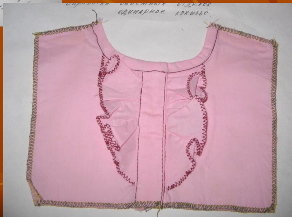
ОБРАБОТКА ОБОЕМНОГО ОТДЕЛКА ОДИНАРНОЕ КОКИЛЬЕ