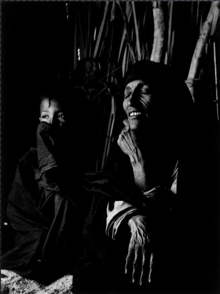
Алжир. Таманрассет. Матриарх племени Туарегов. 1957 год.