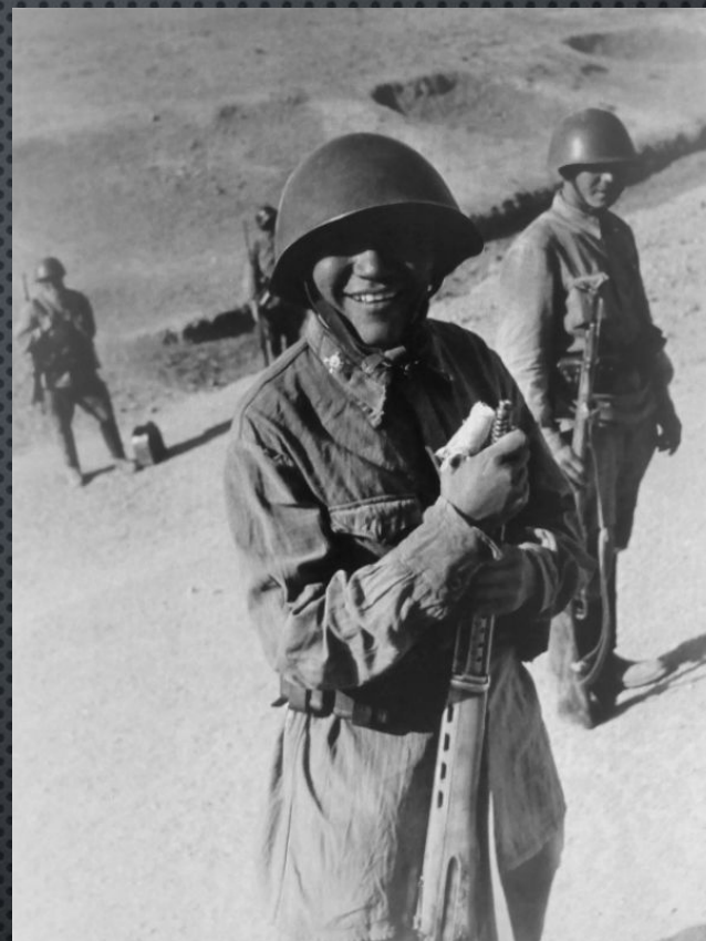
БОЙЦЫ КРАСНОЙ АРМИИ В РАЙОНЕ КАЗВИНА (ИРАН), ГДЕ ПРОИЗОШЛА ВСТРЕЧА СОВЕТСКИХ И БРИТАНСКИХ ВОЙСК ВО ВРЕМЯ ОПЕРАЦИИ «СОГЛАСИЕ» («OPERATION COURTENANCE»). АВГУСТ – СЕНТЯБРЬ 1941 ГОДА.