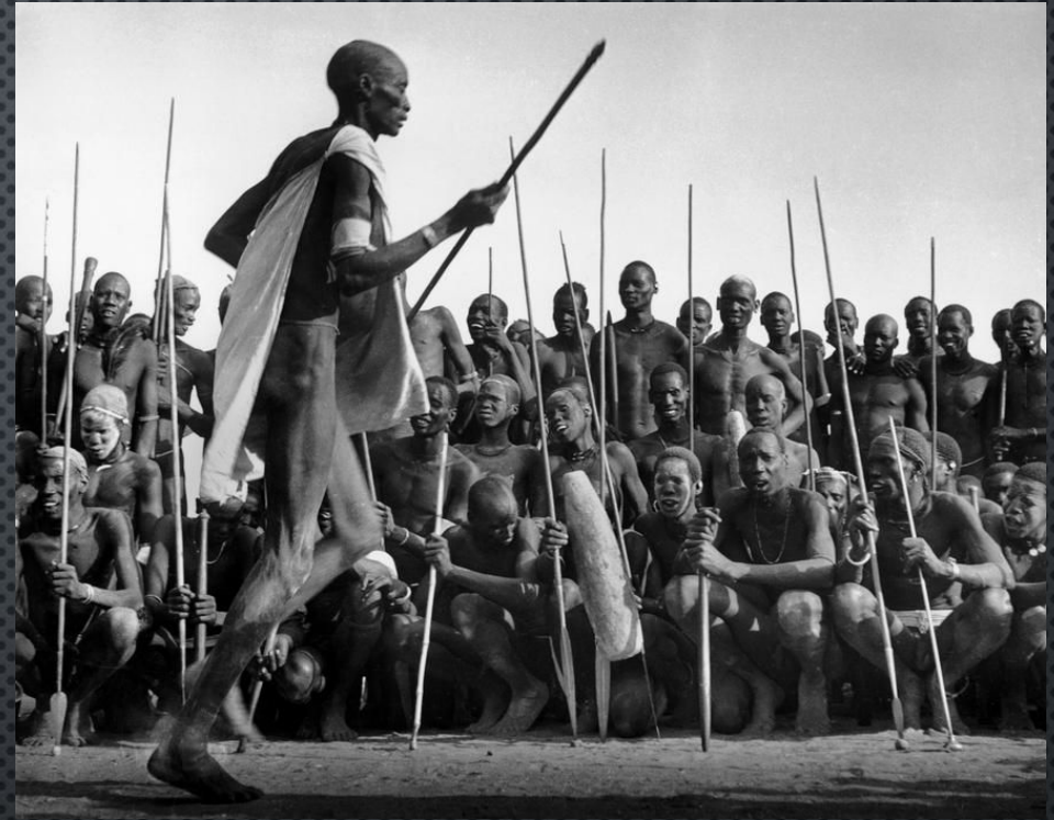
Южный Судан. Вождь Динка призывает своих воинов в Дук Фадият. 1949 год.