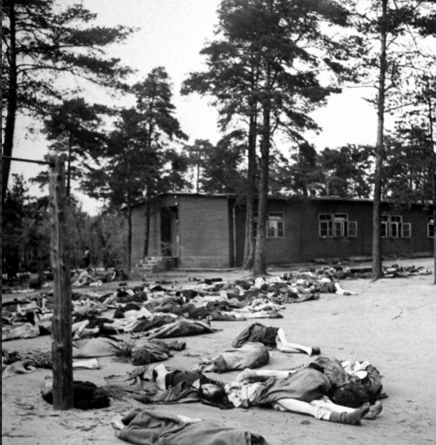
ТЕЛА УМЕРШИХ УЗНИКОВ БЕРГЕН-БЕЛЬЗЕНА НА ФОНЕ ЛАГЕРНОГО БАРАКА. АПРЕЛЬ 1945 ГОДА.