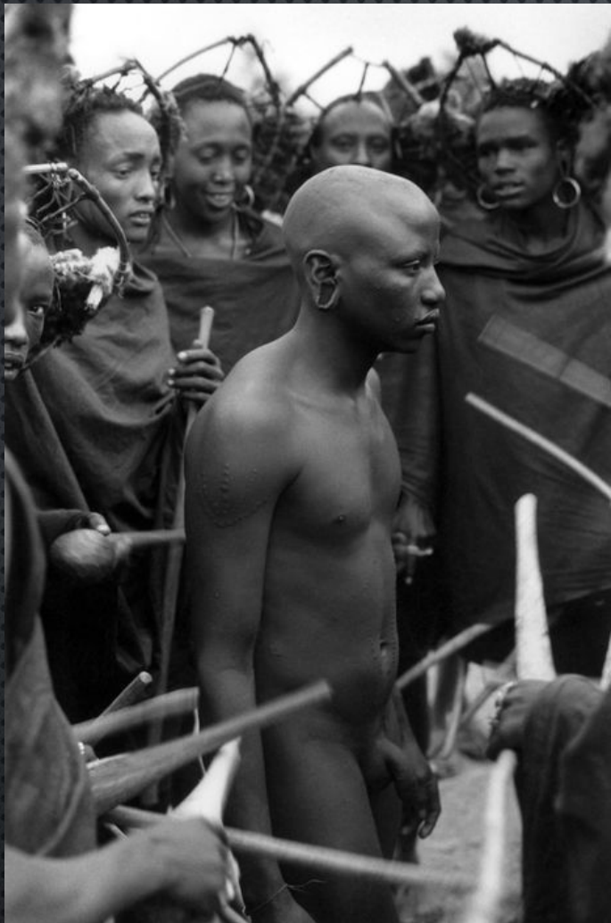
Кения. МАСАЙ ОТПРАВЛЯЕТСЯ НА ЦЕРЕМОНИЮ ОБРЕЗАНИЯ. 1979 ГОД.