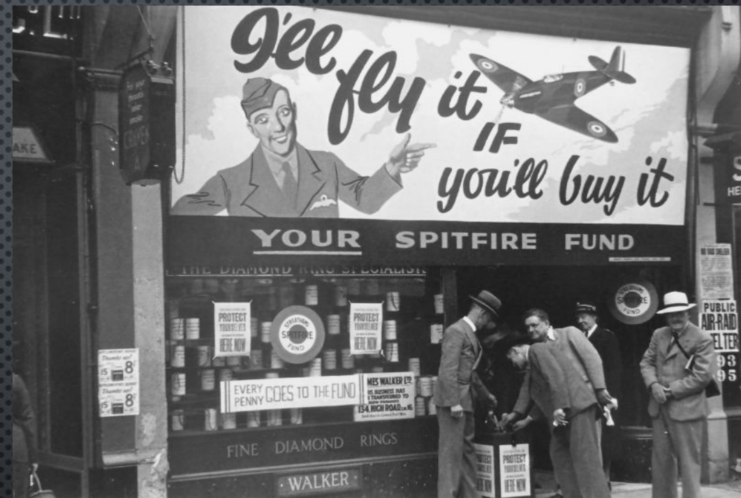
БРИТАНСКИЕ СПАСАТЕЛИ ИДЕНТИФИЦИРУЮТ ПОГИБШИХ В КОВЕНТРИ (COVENTRY) ПОСЛЕ БОМБАРДИРОВКИ ЛЮФТВАФФЕ. 1940 ГОД.