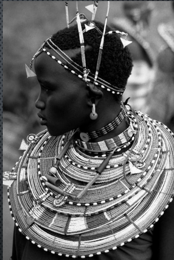
Кения. МАСАЙ МОРАН ЦЕРЕМОНИЯ ОБРЕЗАНИЯ. 1979 ГОД.