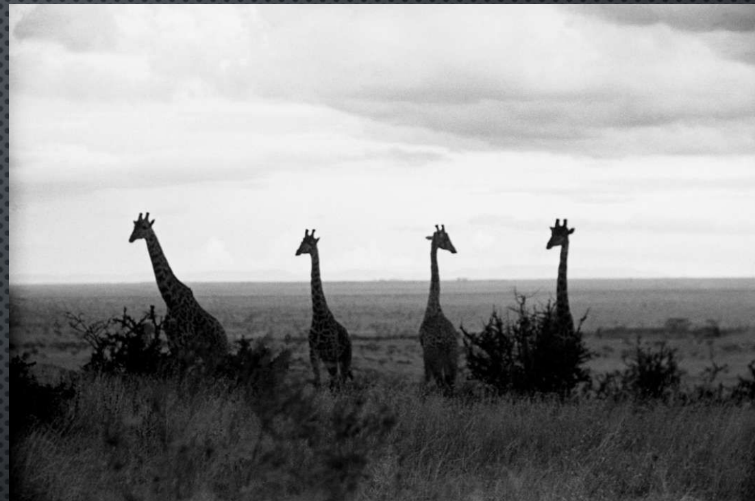
УГАНДА. МАЛЕНЬКАЯ ГРУППА ЗЕБР НА КАНАЛЕ КАЗИНГА. 1948 ГОД.