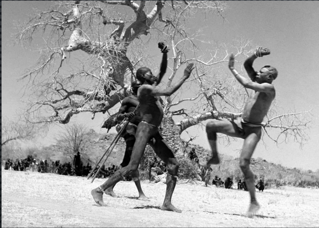
Судан. Кордофан. Два бойца из племени Као-Ньяро, которые используют смертоносные браклеты во время боёв. 1949 год.