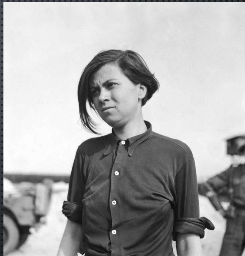
БЫВШАЯ ОХРАННИЦА КОНЦЛАГЕРЯ БЕРГЕН-БЕЛЬЗЕН АННЕЛИЗЕ КОЛЬМАНН (ANNELIESE KOHLMANN, 1921—1977) ВО ВРЕМЯ РАЗГРУЗКИ ТЕЛ УЗНИКОВ. 23 АПРЕЛЯ 1945 ГОДА.