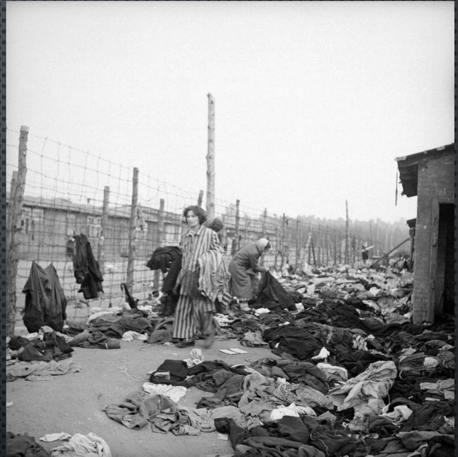
БЫВШИЕ УЗНИЦЫ КОНЦЛАГЕРЯ БЕРГЕН-БЕЛЬЗЕН РАЗБИРАЮТ ВЕЩИ ПЕРЕД ДЕЗИНФЕКЦИЕЙ. АПРЕЛЬ 1945 ГОДА.