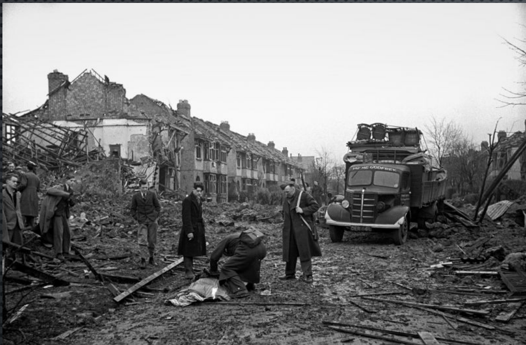
БРИТАНСКИЕ СПАСАТЕЛИ ИДЕНТИФИЦИРУЮТ ПОГИБШИХ В КОВЕНТРИ (COVENTRY) ПОСЛЕ БОМБАРДИРОВКИ ЛЮФТВАФФЕ. 1940 ГОД.