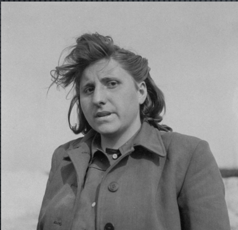
БЫВШАЯ ОХРАННИЦА КОНЦЛАГЕРЯ БЕРГЕН-БЕЛЬЗЕН МАГДАЛЕНЕ КЕССЕЛЬ (MAGDALENE KESSEL) ПОСЛЕ АРЕСТА. 23 АПРЕЛЯ 1945 ГОДА.