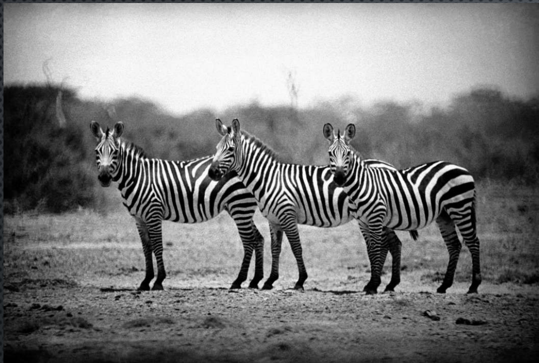
УГАНДА. СТАДО ЖИРАФОВ НА КАНАЛЕ КАЗИНГА. 1948 ГОД.