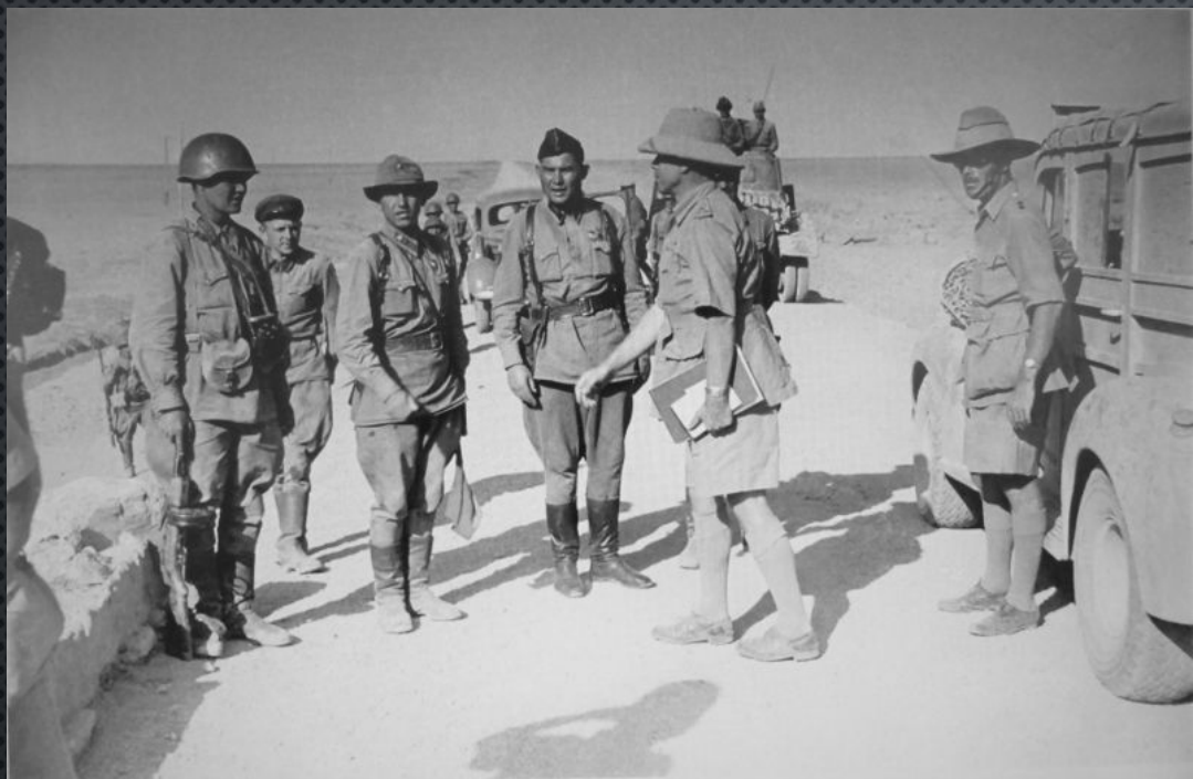
ВСТРЕЧА СОВЕТСКИХ И БРИТАНСКИХ ВОЕННОСЛУЖАЩИХ НА ДОРОГЕ В РАЙОНЕ КАЗВИНА В ИРАНЕ. СОВЕТСКО- БРИТАНСКАЯ ОПЕРАЦИЯ «СОГЛАСИЕ» («OPERATION COURTENANCE»). АВГУСТ – СЕНТЯБРЬ 1941 ГОДА.