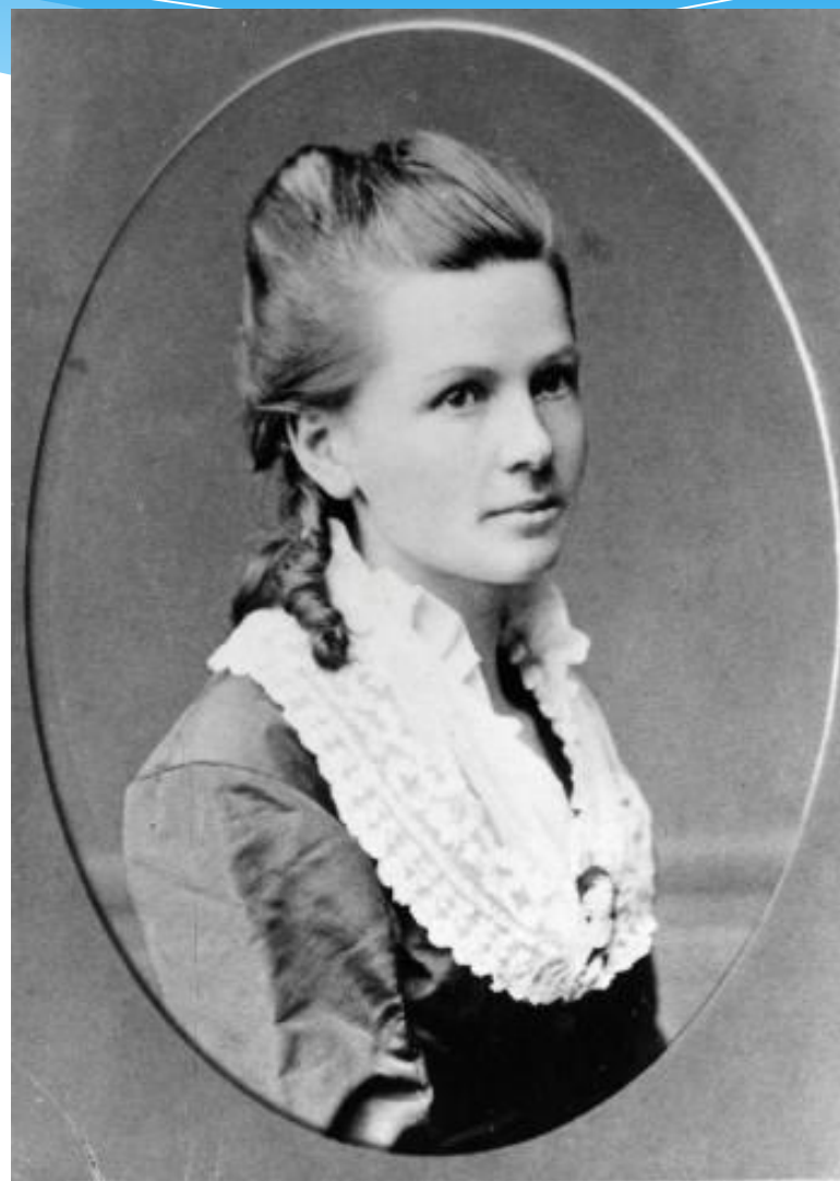
Jugendbildnis von Frau Berta Benz

В августе 1888 года Берта Бенц с сыновьями 15 и 13 лет без ведома Карла, совершила на нём поездку в соседний город на расстояние 106 км.