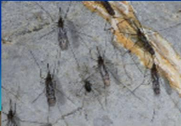
Зимующие комары в пещере на Южном Урале

Половой и возрастной состав может изменяться очень сильно, например, в популяции комаров зимуют только самки, все самцы погибают, но летом их численность резко возрастает