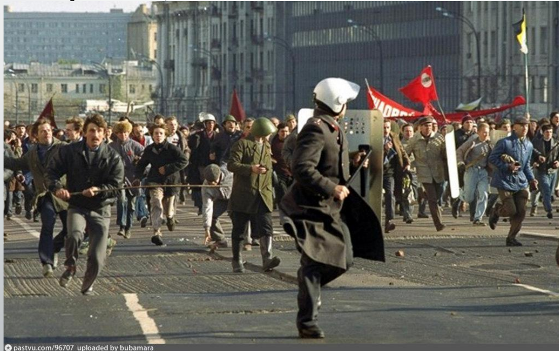
Уличные бои в Москве