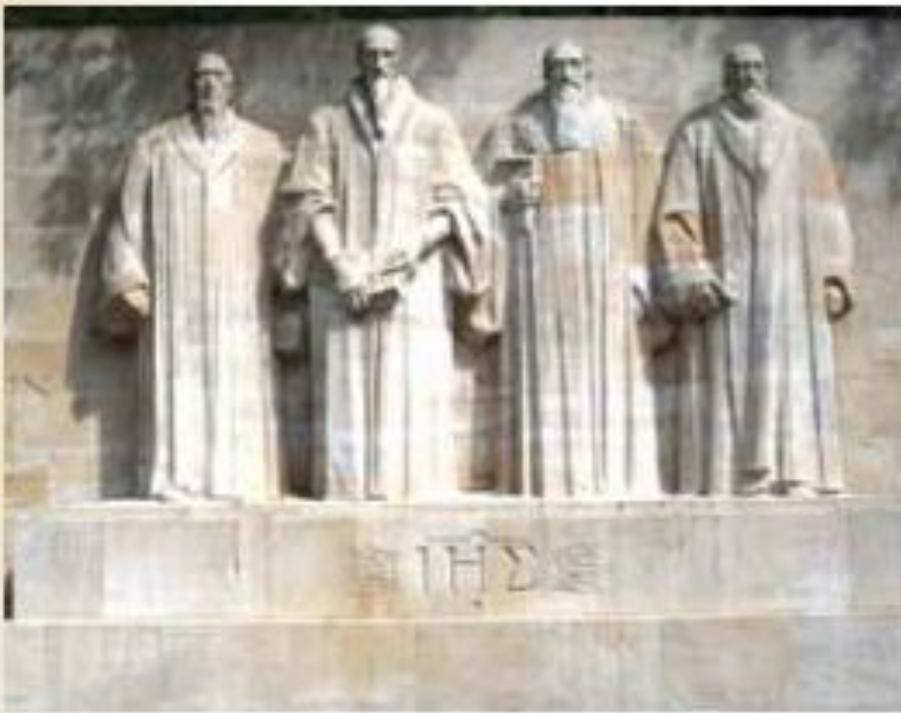
Пам'ятник «Стіна Реформації» в м. Женева, Швейцарія (фрагмент, робота скульптора Поля Ландовські, ХХ ст.)

У центрі композиції цієї пам'ятки Реформації стоять чотири найвищі (по 5 метрів кожна) статуї головних діячів кальвінізму: Теодор Беза (1519—1605), Жан Кальвін (1509—1564), Гійом Фарель (1489—1565), Джон Нокс (1513 — 1572)