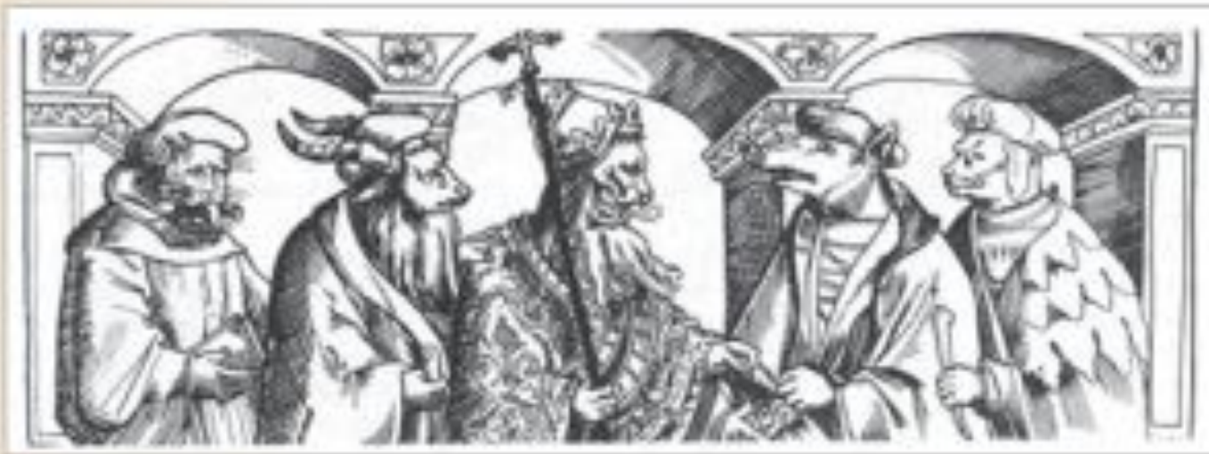
Папа Римський і богослови (карикатура XVI ст.)

Розгляньте карикатуру. Поміркуйте, що хотів висміяти автор. Що спільного було між церковною і світською владою в XVI ст.