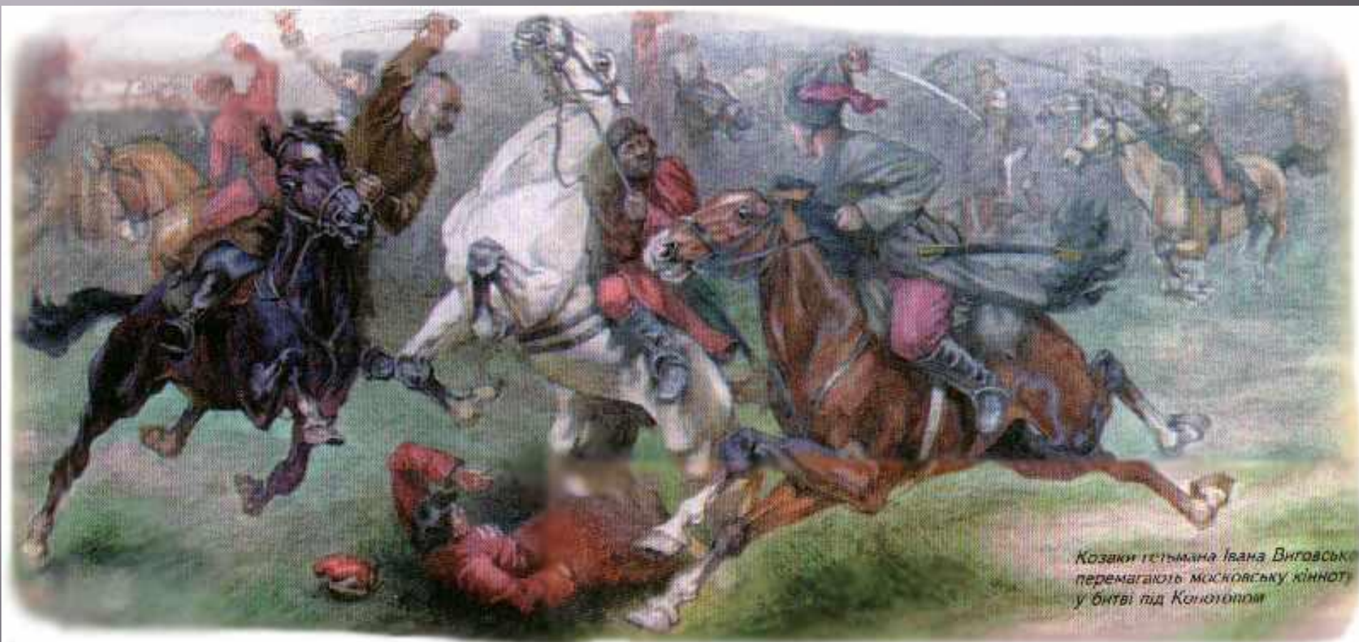
Козаки гетьмана Івана Виговського перемагають московську кінноту у битві під Конотопом