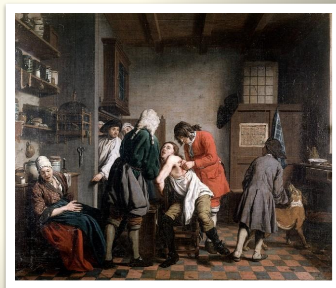
Врачевание в эпоху Средневековья