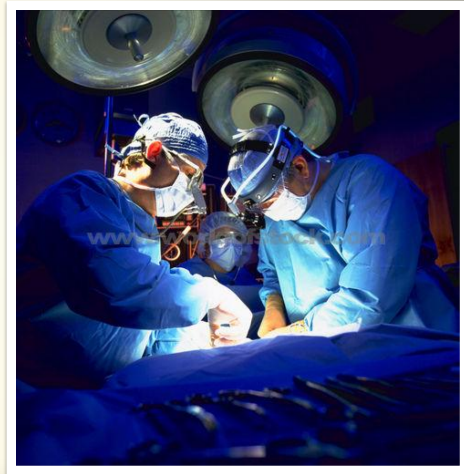
Хирурги высочайшего класса оперируют травмированного ребёнка

Профессия врача относится к типу: «Человек – Человек», ведь она связана с общением и взаимодействием с людьми. Для успешного выполнения такой работы требуется умение устанавливать и поддерживать деловые контакты, понимать людей, проявлять активность, общительность, обладать развитыми лексическими способностями и вербальным мышлением. Профессия врача относится к классу эвристических . Она предполагает профессиональную деятельность, которая связана с анализом, исследованиями и испытаниями, контролем и планированием, управлением другими людьми. Она требует высокой эрудиции, оригинальности мышления, стремления к развитию и постоянному обучению.