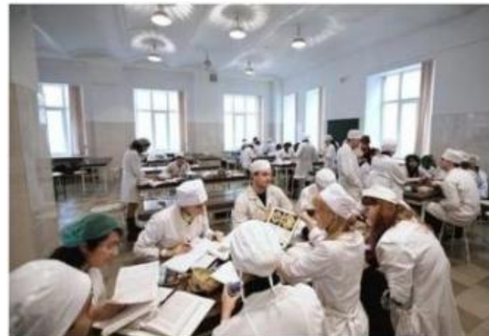
Занятия в медицинских институтах