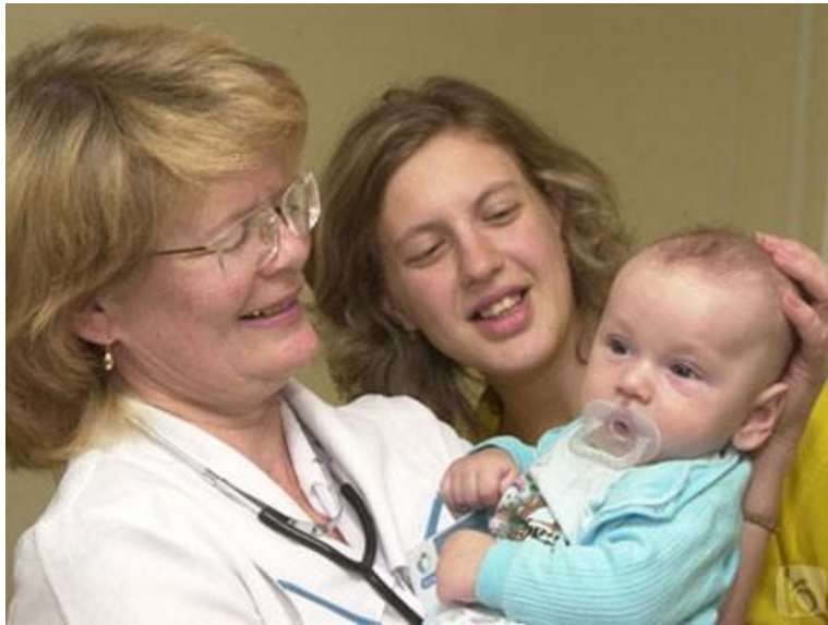
Мастера своего дела

Ценят педиатров по опыту работы и квалификации, поэтому очень сложно приходится вчерашним выпускникам. Врач должен быть хорошим психологом, так как работать предстоит с детьми, которым не объяснишь, что «тётя-доктор хорошая» — он должен это сам почувствовать. Педиатр должен быть внимательным, добрым и, конечно же, любить детей, уметь оказать квалифицированную помощь даже в самой сложной ситуации.