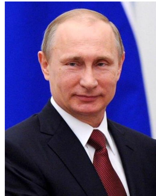
Президент России Владимир Путин