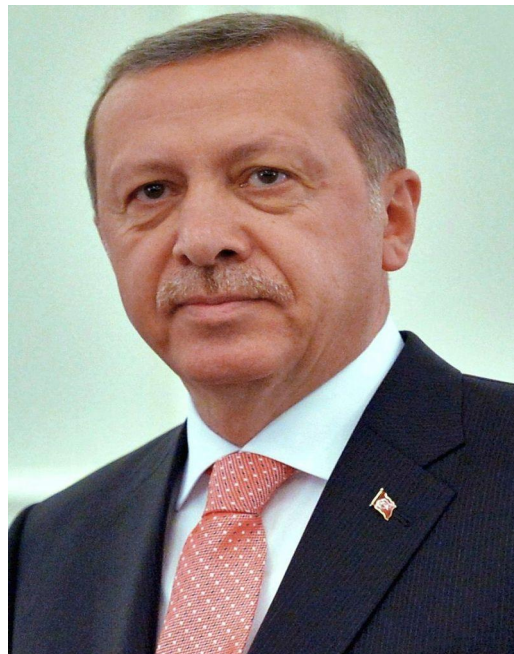
Президент Турции Реджеп Эрдоган