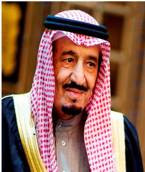
Король Саудовской Аравии Салман Аль Сауд