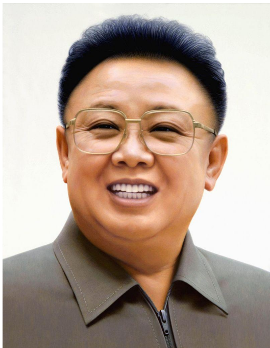
Диктатор КНДР Ким Чен Ир