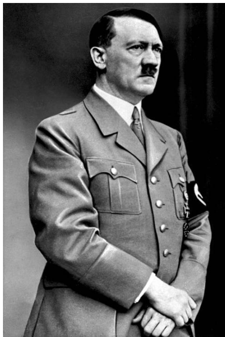
Фюрер Германии Адольф Гитлер