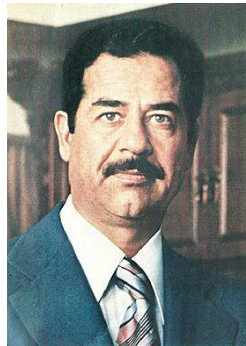
Президент Ирака Саддам Хуссейн