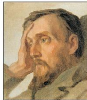
Виссарион Григорьевич Белинский (1811 – 1848 )