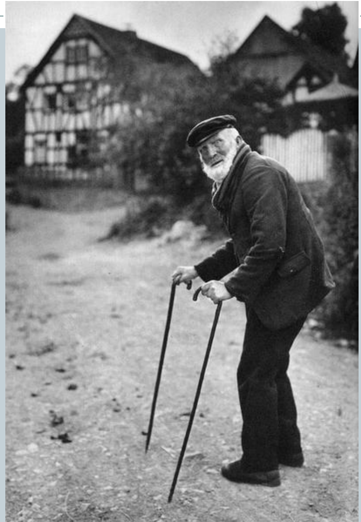
Старый фермер, Вестервальд, 1912