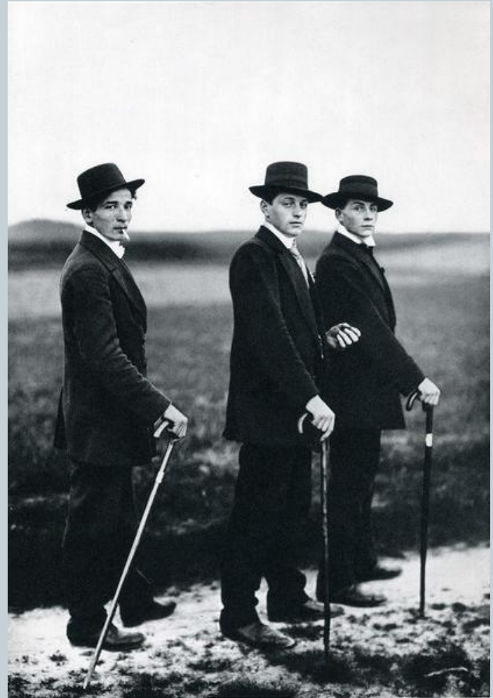
Молодые фермеры, Вестервальд, 1912