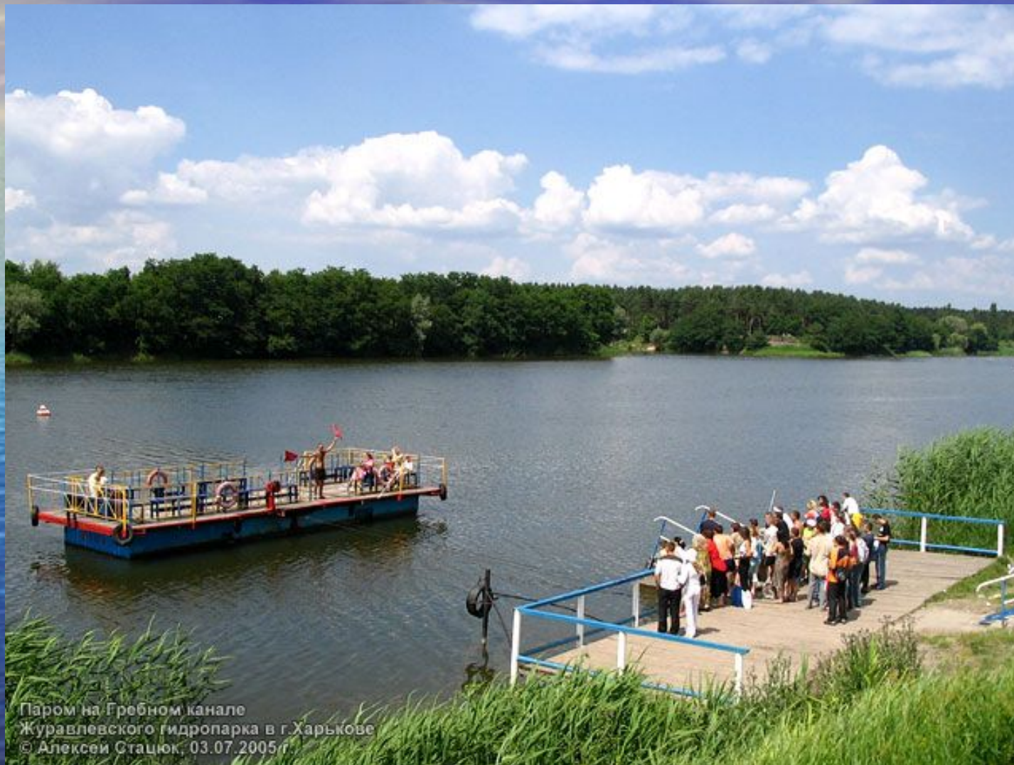
Паром на Гребном канале Журавлевского гидропарка в г. Харькове