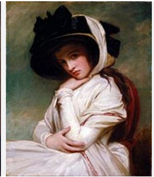
Эмма Гамильтон (1765-1815). (Художник – Джордж Ромни ) - дочь крестьянина, куртизанка, ставшая музой великого художника, супруга лорда Гамильтон, подруга королев, любимая адмирала Нельсона. Художник Джордж о 60 ее