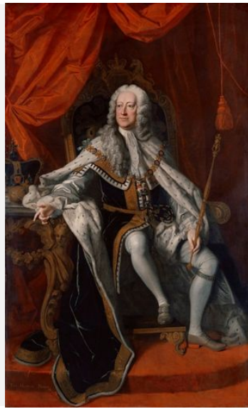
Георг II (1683-1760) — король Великобритании с 1727 года, сын Георга I. Последний монарх Британии, родившийся за её пределами.