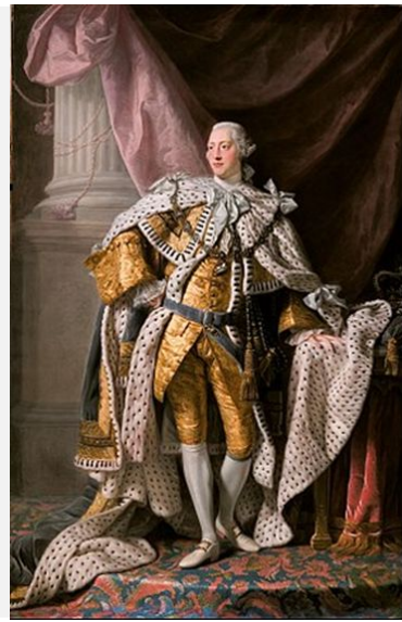
Георг III (1738-1820) — король Великобритании с 1760. (Художник Данс, один из п-тов короля есть в Эрмитаже ). Долгое правление Георга III (59 лет - третье по продолжительности после царствования Елизаветы II и Виктории) ознаменовалось революционными событиями в мире: отделением от британской короны американских колоний и образованием США, Великой французской революцией и Наполеоновскими войнами. В историю Георг вошёл также как жертва тяжёлого психического заболевания, по причине которого над ним с 1811 года было установлено регентство