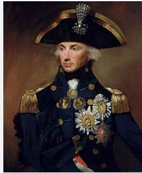
Адмирал Горацио Нельсона (1758-1805) (художник - Фрэнсис Эбботт, 1800) Его путь к адмиральскому званию был долог и тернист. От юнги до командующего флотом. Личная доблесть Нельсона несомненна. В 1794 г., командуя десантом на Корсике, он получил осколочное ранение и едва не потерял глаз. А через три года, в сражении на Канарских островах, лишился правой руки. Именно под его руководством был разгромлен французский (сражение при Абукире) и испанский (Трафальгарское сражение) флот. Любовница – леди Гамильтон.