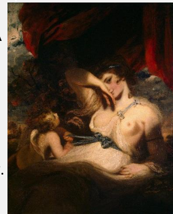
Рейнолдс - Амур развязывает пояс Венеры, Эрмитаж