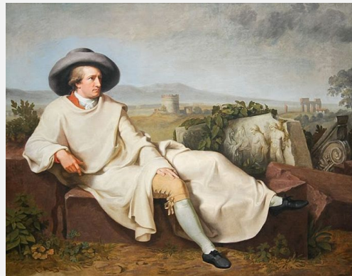
«Гёте в Римской Кампанье» кисти Тишбейна, 1787

Гёте (1749-1832) (Художник — Анжелика Кауфманн, 1787) - величайший немецкий поэт, просветитель, государственный, политический деятель, ученый, мыслитель, философ. «Страдания юного Вертера»,