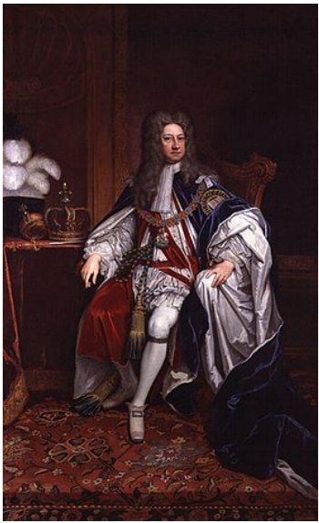
Георг I (1660-1727) король Великобритании 1714, первый представитель Ганноверской (немецкой) династии на королевском троне Великобритании