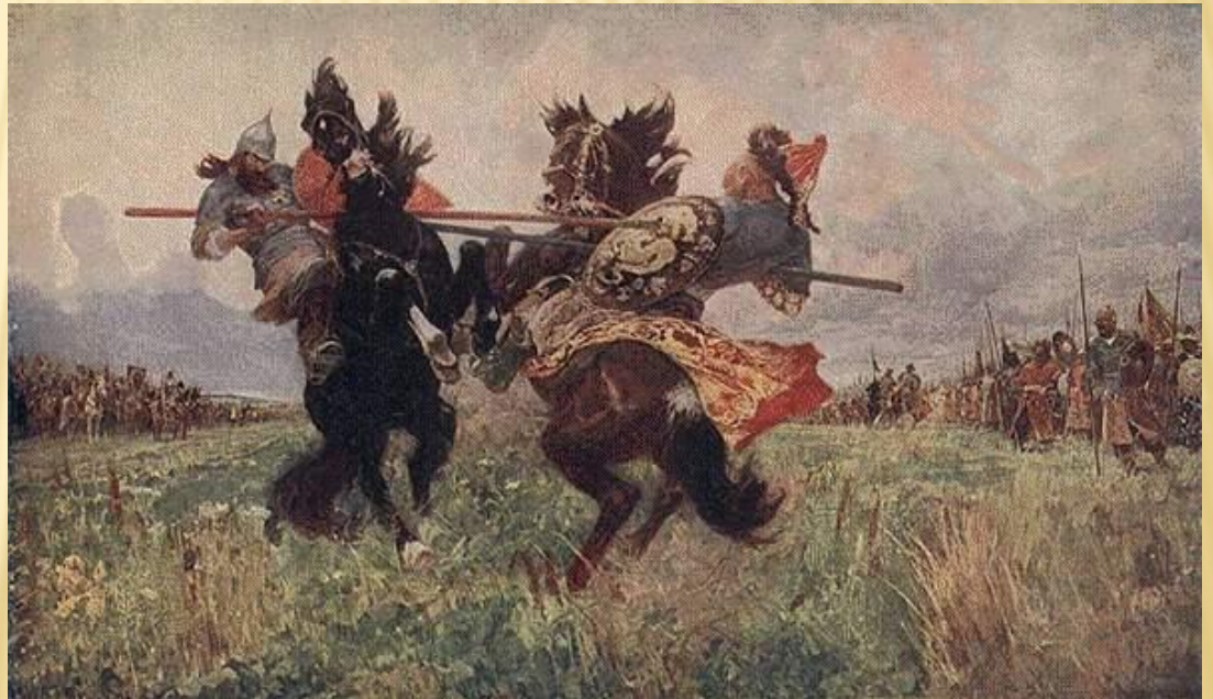
«БОЙ ПЕРЕСВЕТА С ЧЕЛУБЕЕМ» (М.И. АВИЛОВ, 1943)