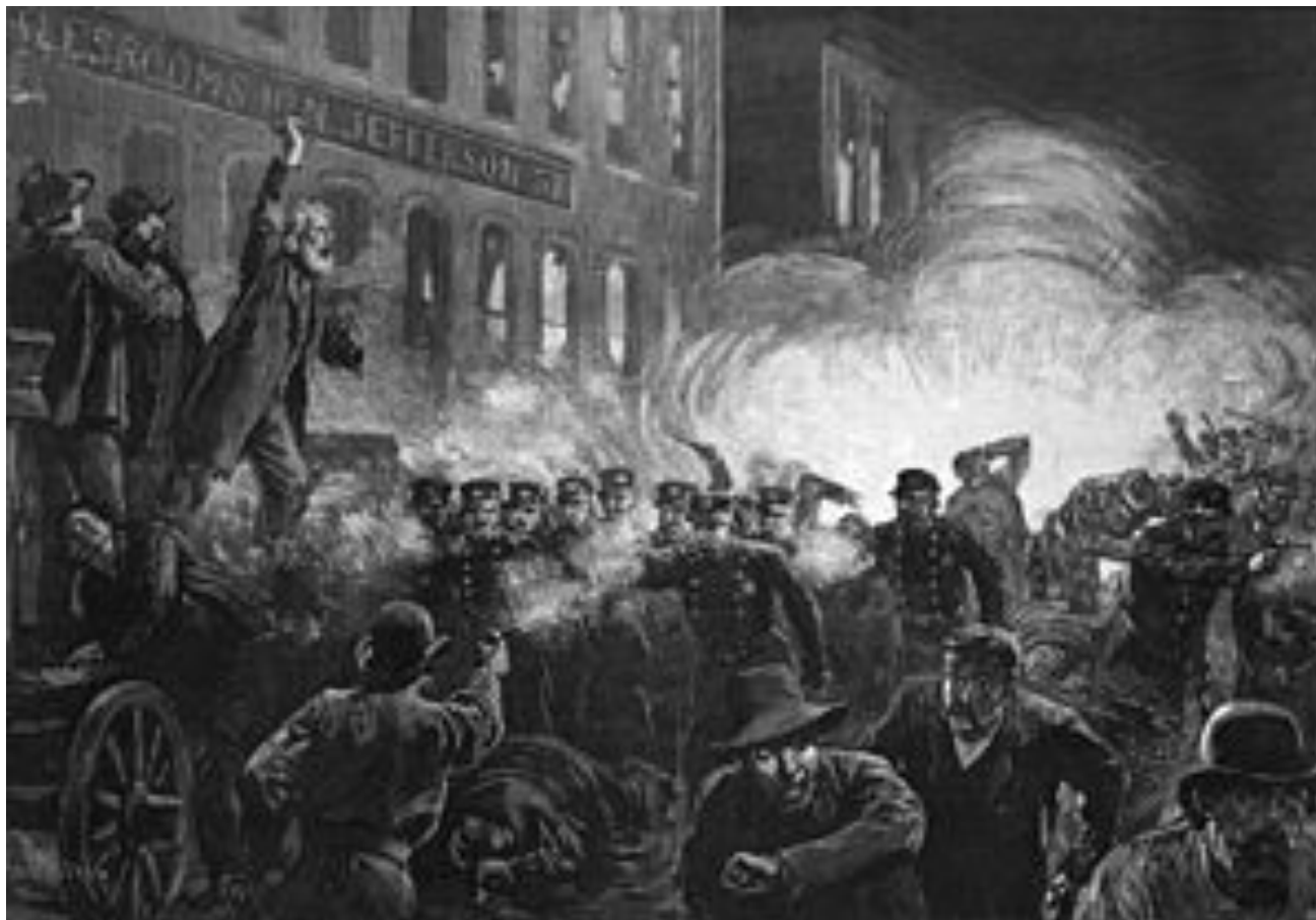
Демонстрация на площади Хеймаркет

С 1 мая 1886 г отмечается международный день солидарности трудящихся. В этот день прошел крупный протест рабочих, требовавших ограничить рабочие часы до 8 часов.