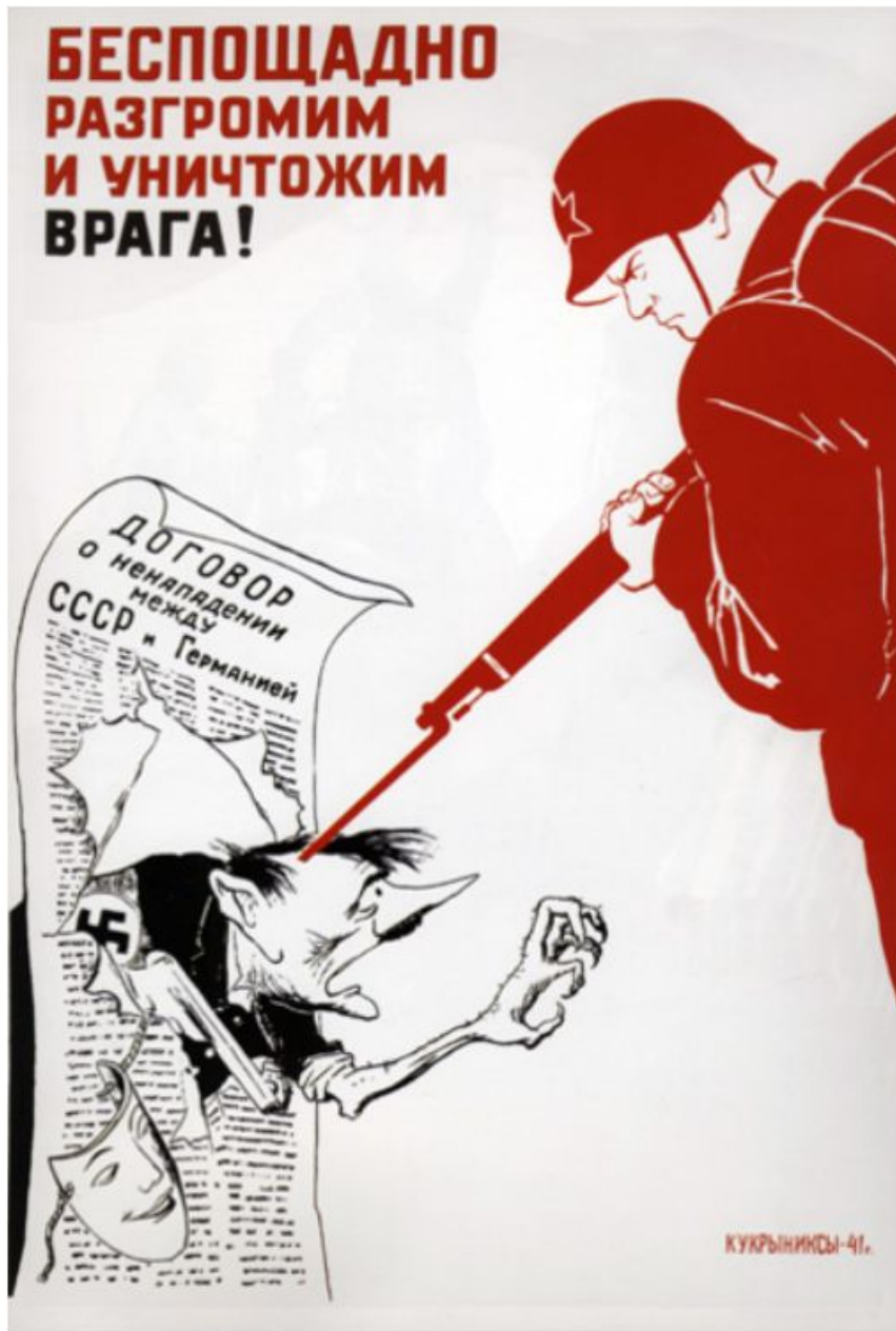
«Беспощадно разгромим и уничтожим врага!», первый военный плакат Кукрыниксов, 1941

На третий день войны на улицах городов появился плакат Кукрыниксов: «Беспощадно разгромим и уничтожим врага!». По сути это было первое подобное произведение, которое задало тон всей советской сатире и творчеству самих карикатуристов. Врага стали «бить» новым оружием, ясно сознавая его преступные намерения и бесчеловечность.