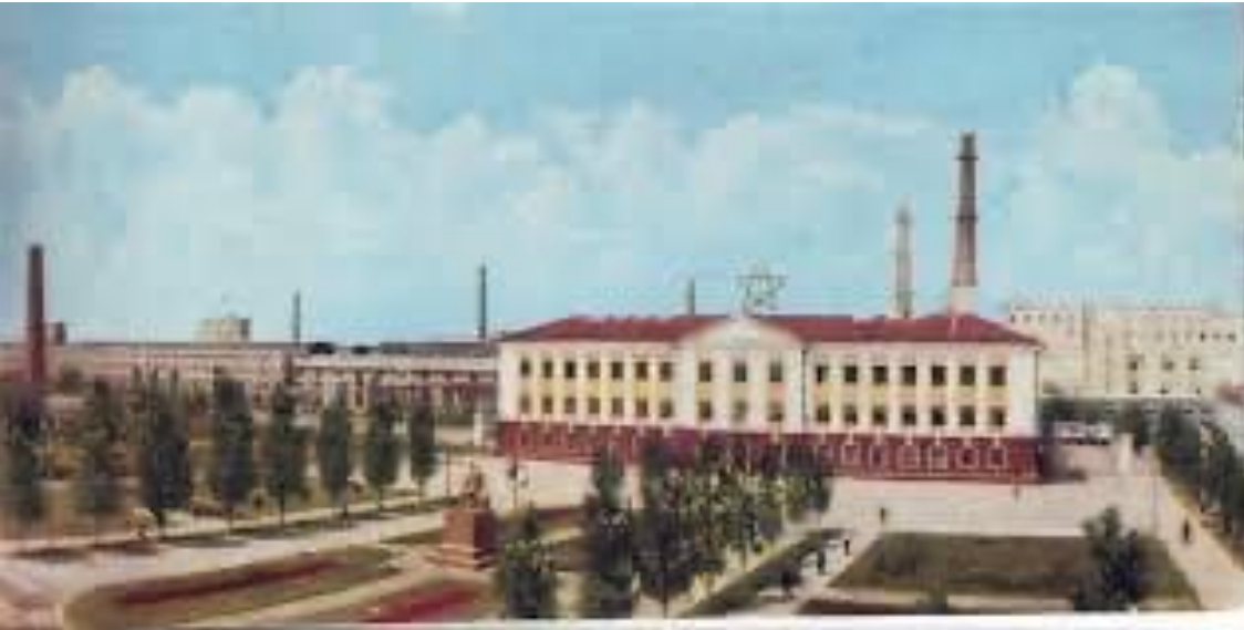
«Техстелко» (завод технического стекла)