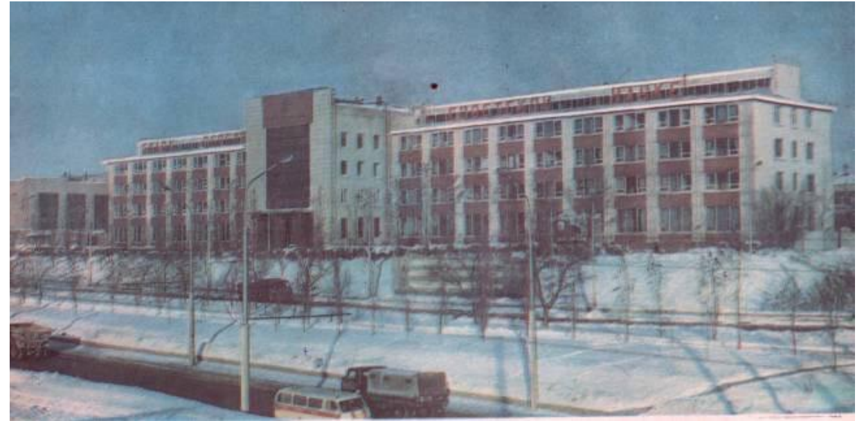
«СИС» (Саратовский институт стекла)