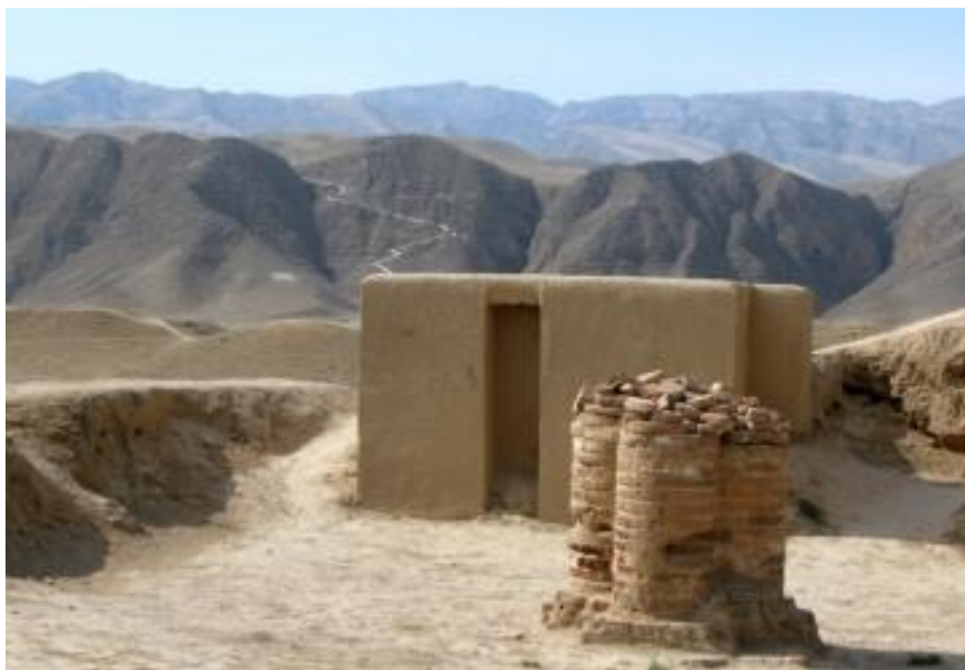
Древний город Ниса