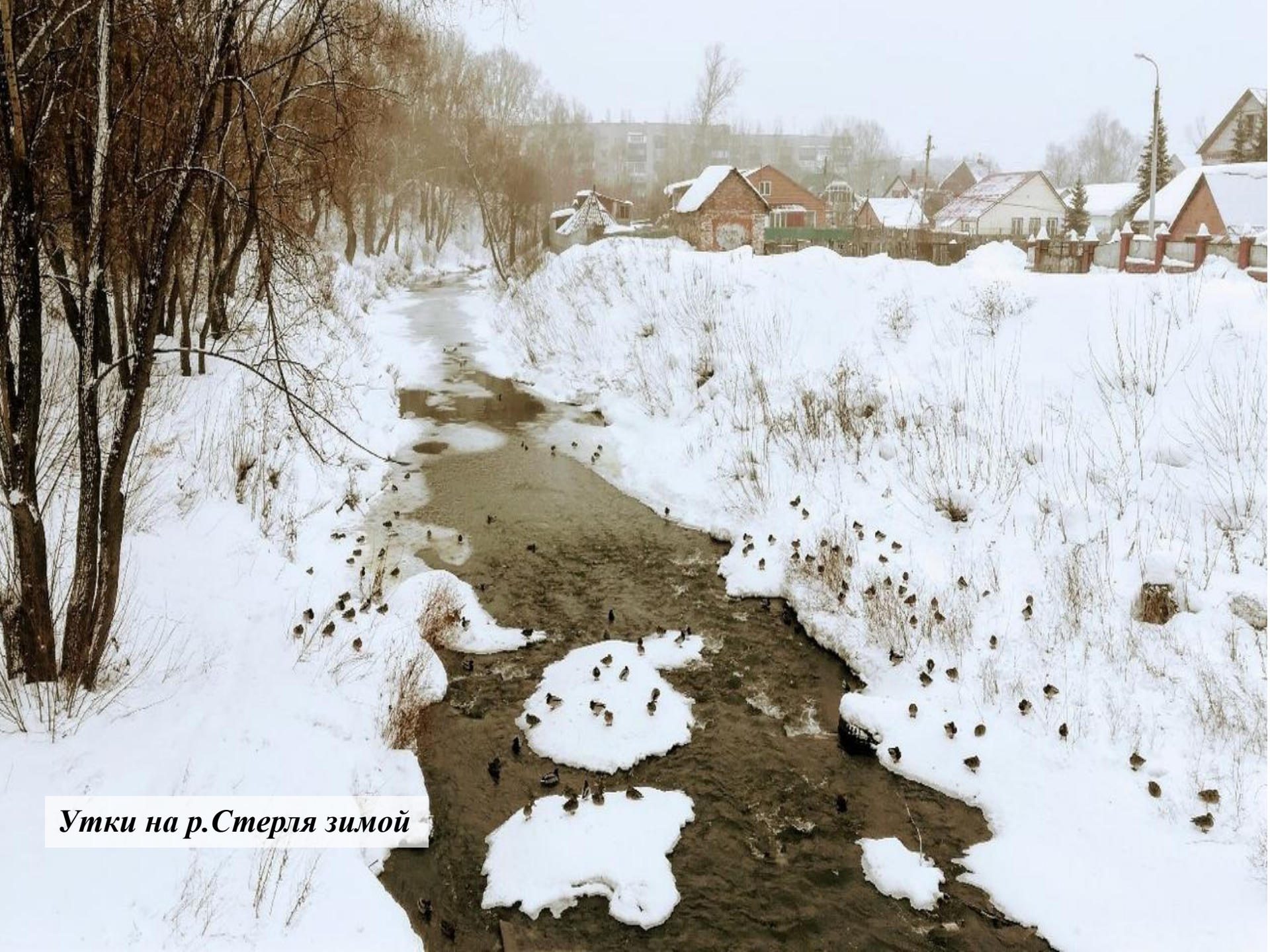
Утки на р.Стерля зимой