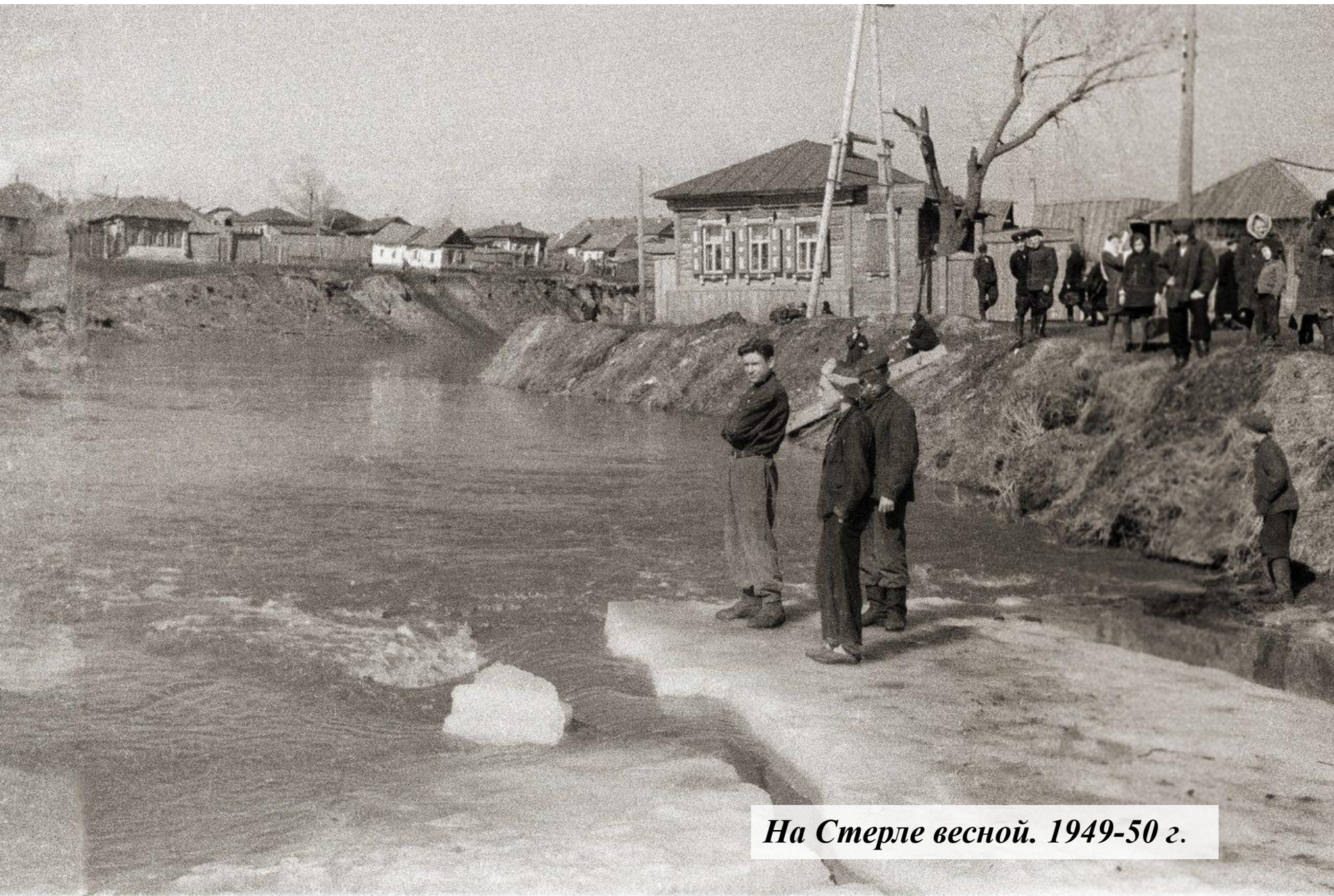
На Стерле весной. 1949-50 г.