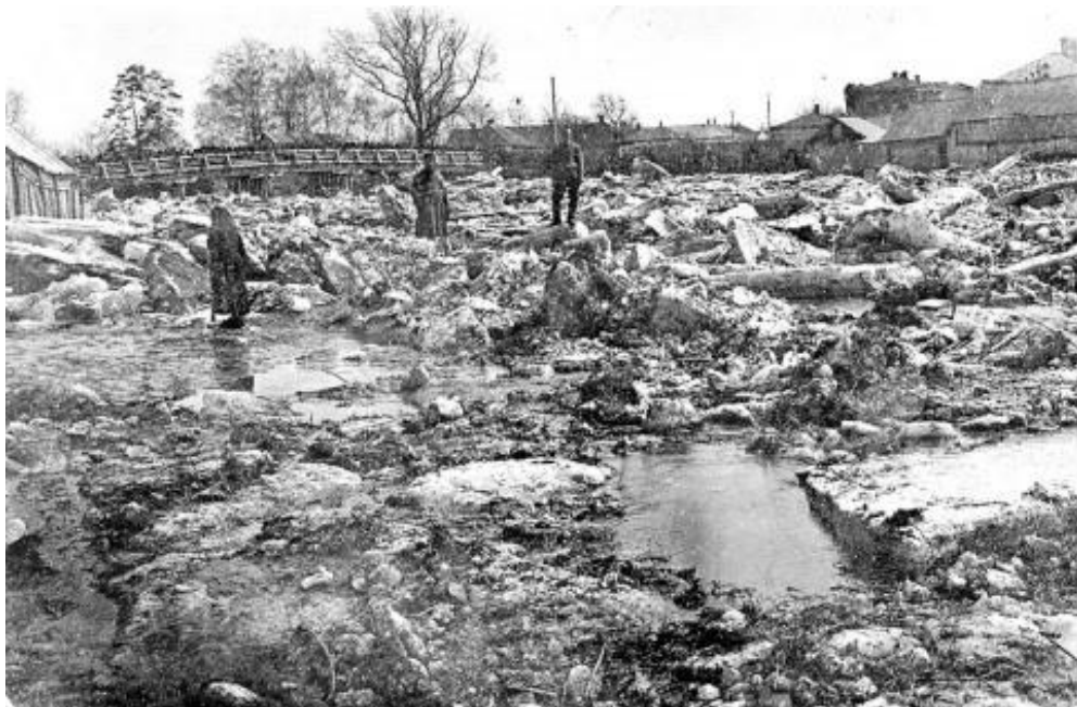
После паводка р. Стерля

В 19 веке это была река с непредсказуемым характером и несколько меняла свое русло. Одно из бывших русел именовали Кривым озером, хотя эту городские власти засыпали ещё в 19 веке. Между улицами Баумана и Нагуманова - Стерля когда-то впадала в Ашкадар. 130 лет назад случился один из паводков, который нанёс серьёзный ущерб северной окраине города. Неожиданно Стерля пробила себе новое русло по одному из оврагов. Кожевенники завалили русло реки отходами своего производства. Но в 1881 году рукотворная «плотина» из шкур, ила и прочего мусора, нанесённого паводком, запрудила реку. И Стерля пошла по другому руслу.