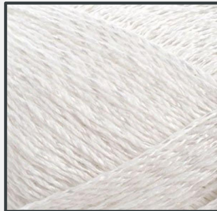
КАЧЕСТВЕННЫЕ МАТЕРИАЛЫ И МАСТЕРСТВО