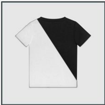
ХЛОПКОВАЯ БАЗОВАЯ ФУТБОЛКА

РУЧНАЯ ВЫШИВКА НА ФУТБОЛКАХ ПО ДИЗАЙНУ ЗАКАЗЧИКА