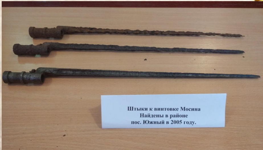
Штыки к винтовке Мосина Найдены в районе пос. Южный в 2005 году.