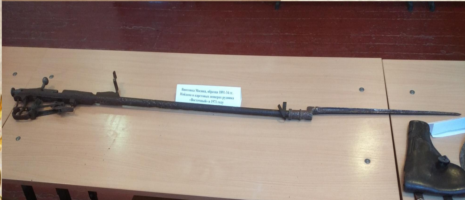
Винтовка Мосина, образца 1891-34 гг. Найдена в карстовых пещерах рудника «Восточный» в 1971 году