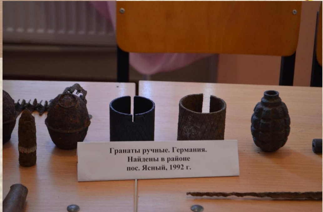
Гранаты ручные. Германия. Найдены в районе пос. Ясный, 1992 г.