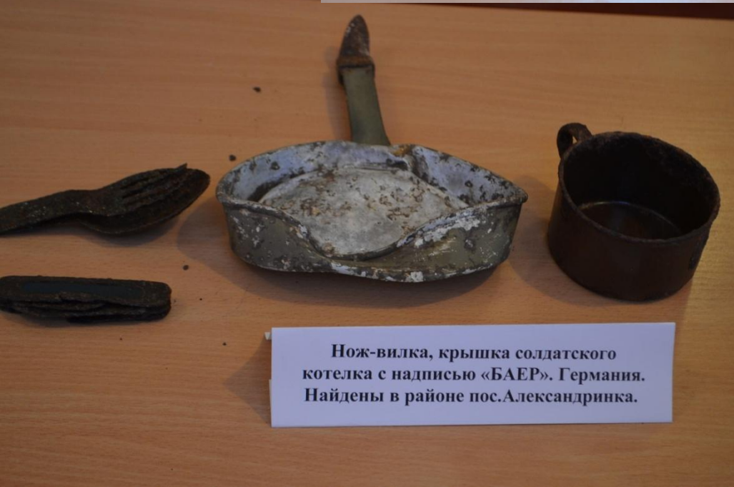
Нож-вилка, крышка солдатского котелка с надписью «БАЕР». Германия. Найдены в районе пос.Александринка.