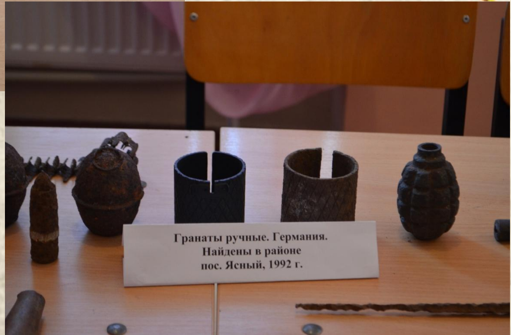
Гранаты ручные. Германия. Найдены в районе пос. Ясный, 1992 г.