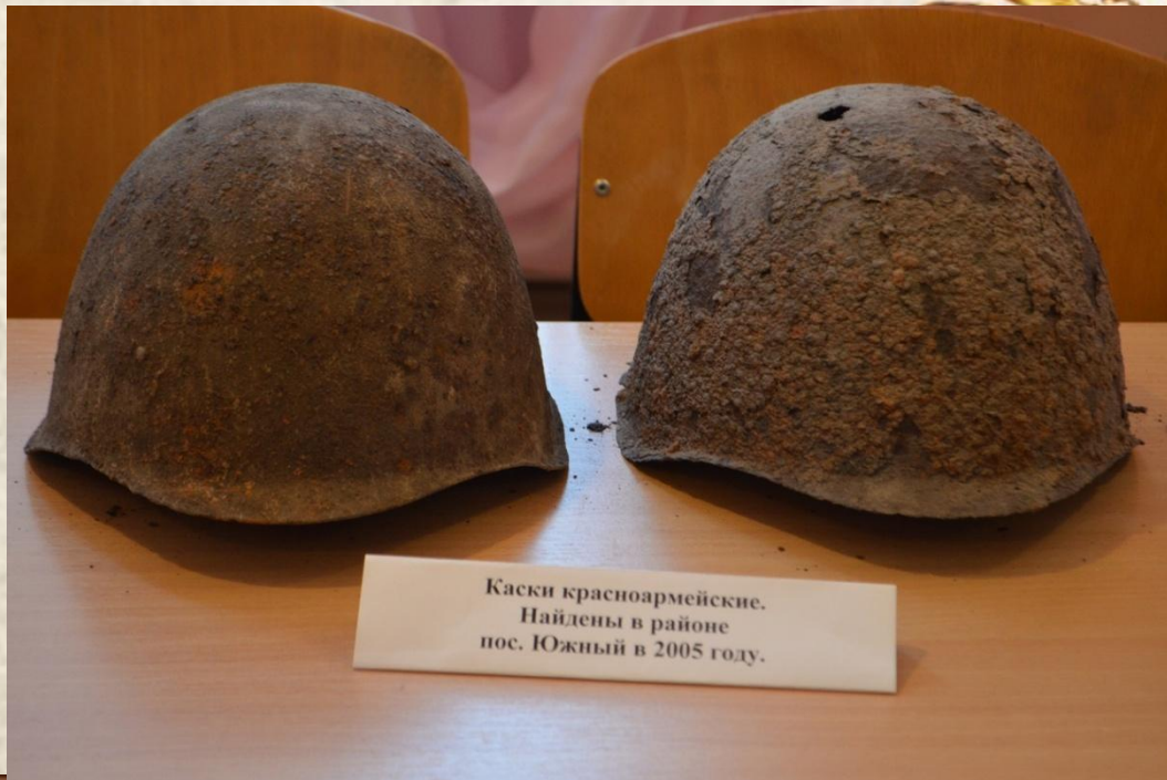
Каски красноармейские. Найдены в районе пос. Южный в 2005 году.