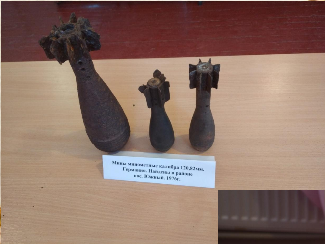
Мины минометные калибра 120,82мм. Германия. Найдены в районе пос. Южный. 1976г.