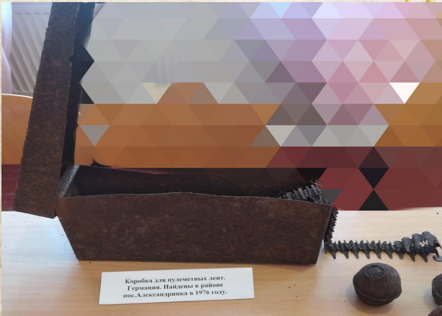
Коробка для пулеметных лент. Германия. Найдены в районе пос.Александринка в 1976 году.