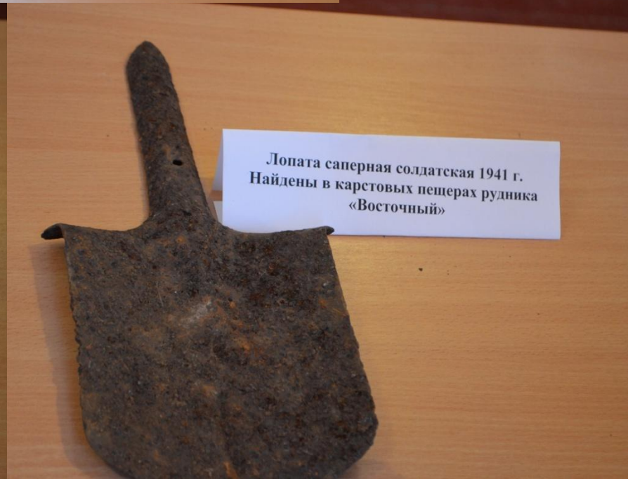
Лопата саперная солдатская 1941 г. Найдены в карстовых пещерах рудника «Восточный»