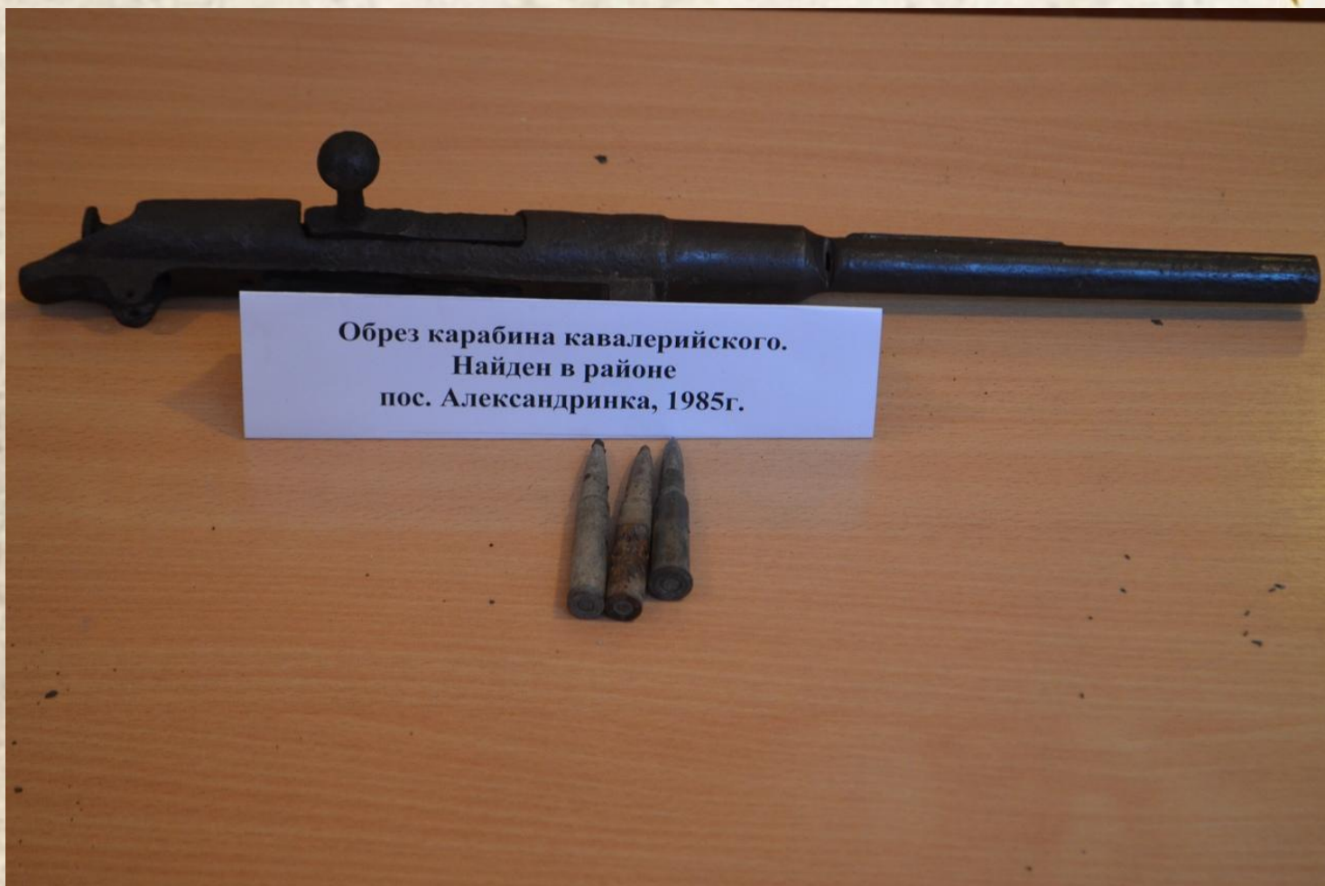
Обрез карабина кавалерийского. Найден в районе пос. Александринка, 1985г.