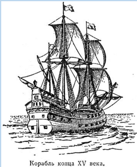
Корабль конца XV века.