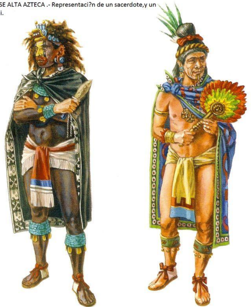
LA CLASE ALTA AZTECA .- Representaci?n de un sacerdote,y un tecuhtli.

Основным одеянием мужчин была набедренная повязка (эш); она представляла собой полосу ткани шириной в ладонь, которую несколько раз обёртывали вокруг талии, затем пропускали между ног так, чтобы концы свисали спереди и сзади. Набедренные повязки именитых персон «с великой заботливостью и красотой» украшались перьями или вышивкой. На плечи набрасывали пати — накидку из прямоугольного куска ткани, также украшенную сообразно общественному положению её владельца. Знатные люди добавляли к этому наряду ещё длинную рубаху и вторую набедренную повязку, похожую на запашную юбку. Их одежды были богато декорированы и выглядели, вероятно, очень красочно, насколько можно судить по сохранившимся изображениям. Правители и военачальники иногда носили вместо накидки шкуру ягуара или закрепляли её