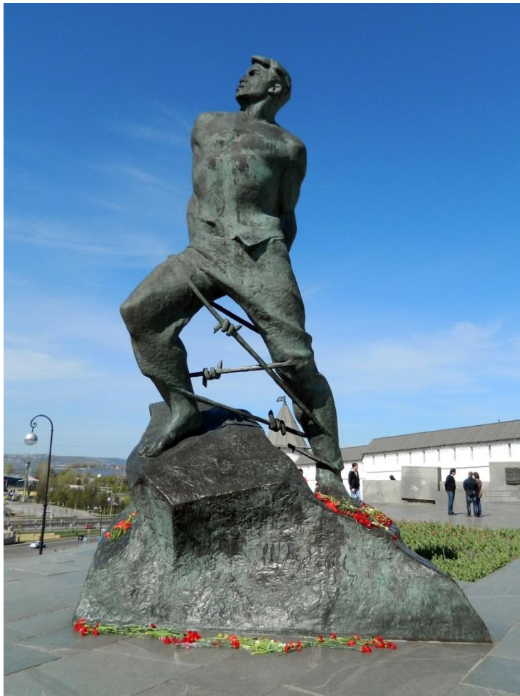
Памятник герою-поэту Мусе Джалилю