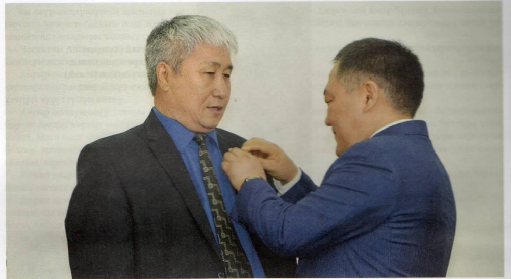
Тываның Улустуң чогаалчызы атты Тываның Баштыңы Ш. Кара-оолдун тывысканы. 2019 ч.