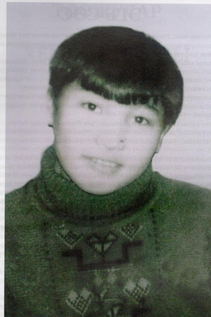
ОГЛУМ МАКСИМНИҢ ЧАПТАНЧЫҒ ОВУР-ХЕВИРИНГЕ ТУРАСКААТТЫМ.