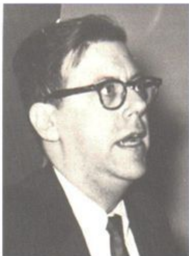
Артур Оукен (1928-1980) экономический советник президента Кеннеди