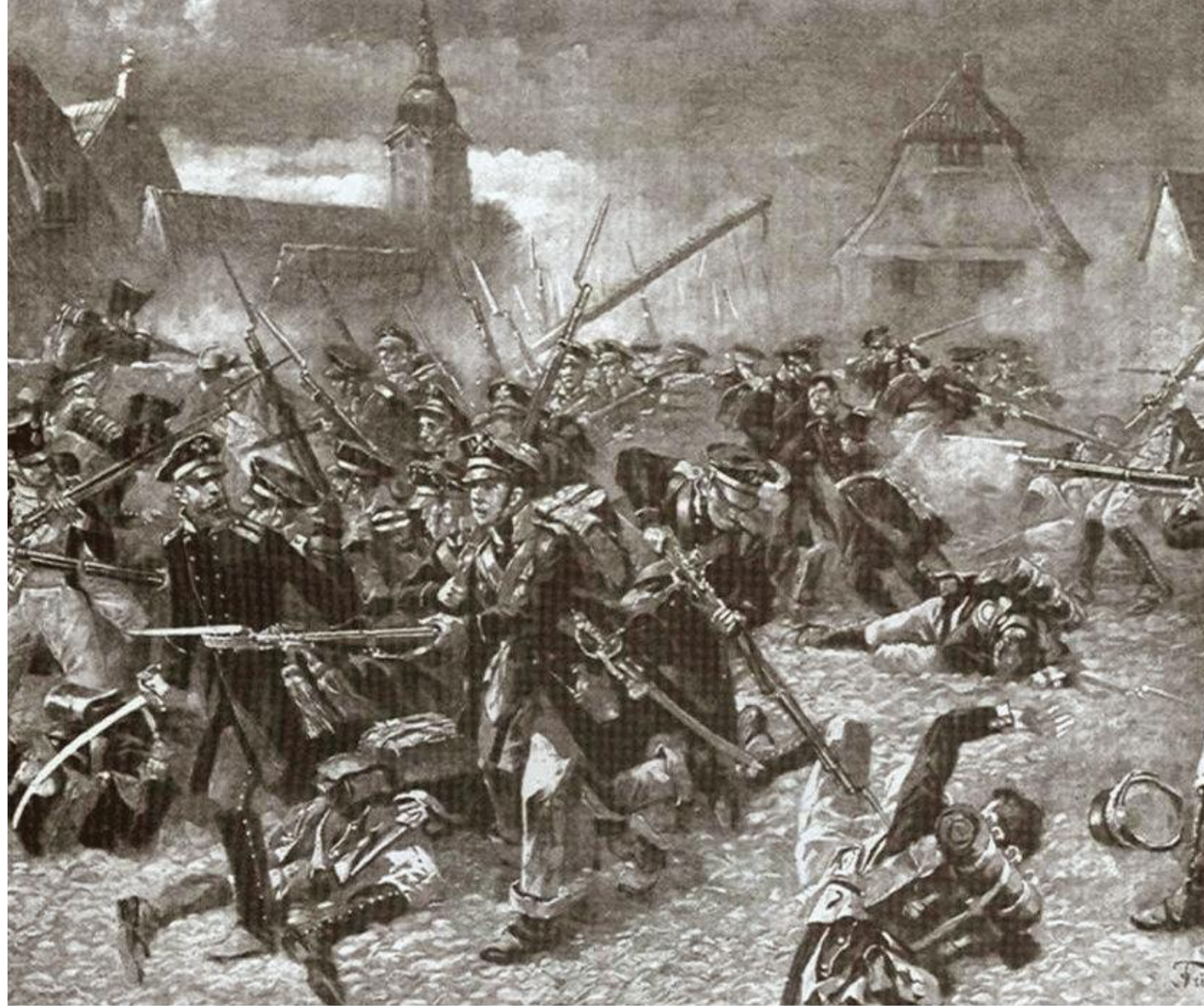
Kampf der ostpreussischen Landwehr beim Grimmaischen Tor in Leipzig am 19. Okto (Gemälde von F. Neumann)

После вывода Великой армии из России зимой 1812 года Наполеон Бонапарт, все еще признанный полководец и император Франции, набрал новую армию и приготовился защищать Францию от сил российской коалиции, в которую входили Пруссия, Швеция и Австрия. Несмотря на то, что Франция собрала армию в 200 000 человек, ее численность была едва ли не меньше трети армии наступавшей на Россию. Малообученные новобранцы не были достойной заменой своим погибшим ветеранам. Напротив, армия Коалиции насчитывала почти 400 000 человек и развернула 1400 единиц артиллерии, что вдвое больше неопытного контингента Наполеона.