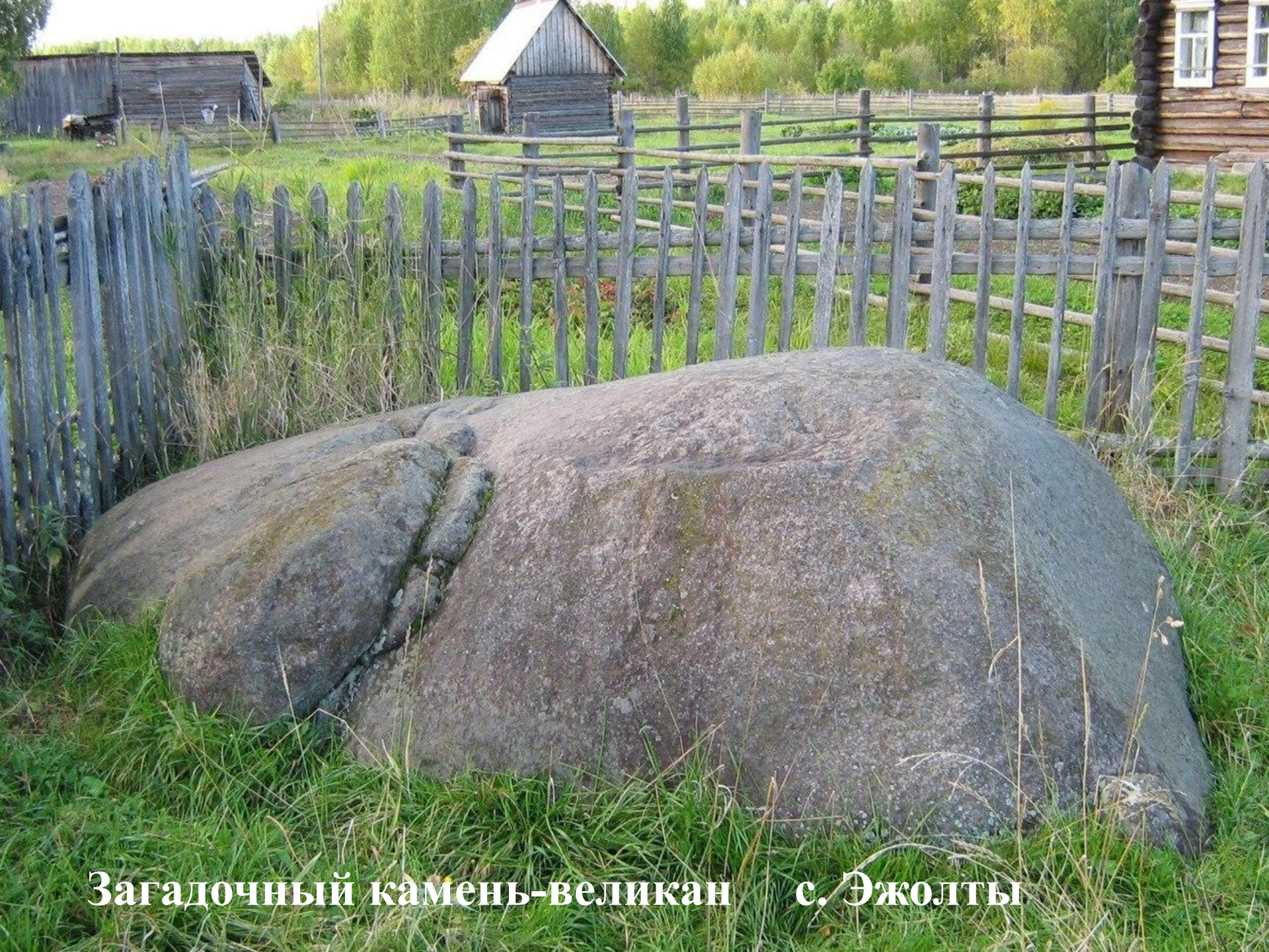
Загадочный камень-великан с. Эжолты