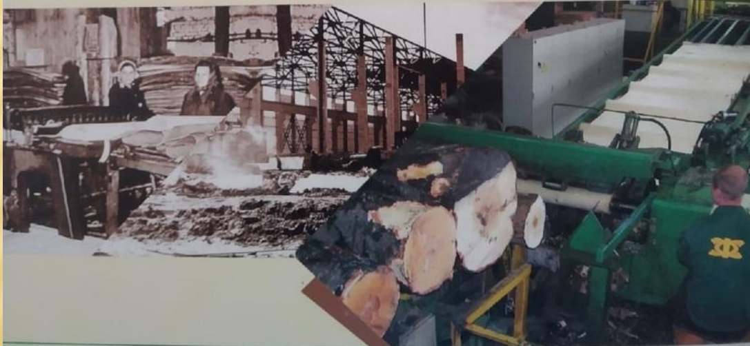
Жешартский фанерный комбинат

На сегодняшний день Жешартский фанерный комбинат по производственным мощностям входит в пятерку крупнейших деревообрабатывающих предприятий России. Качество выпускаемой продукции признано отличным как российскими, так и зарубежными потребителями.