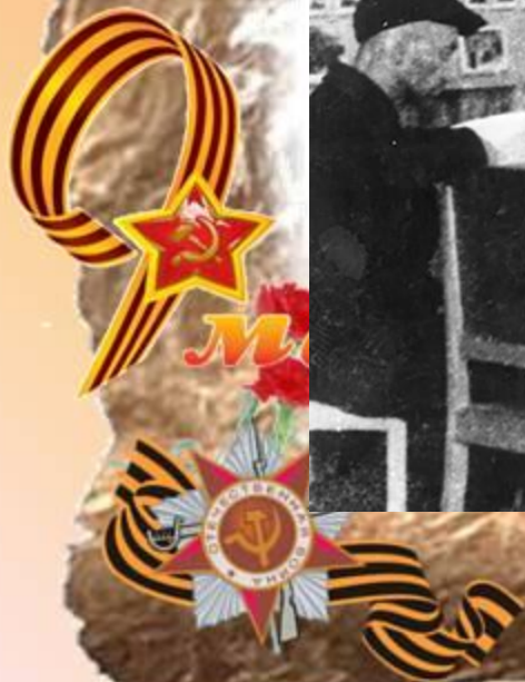
Московское метро ст. Курская