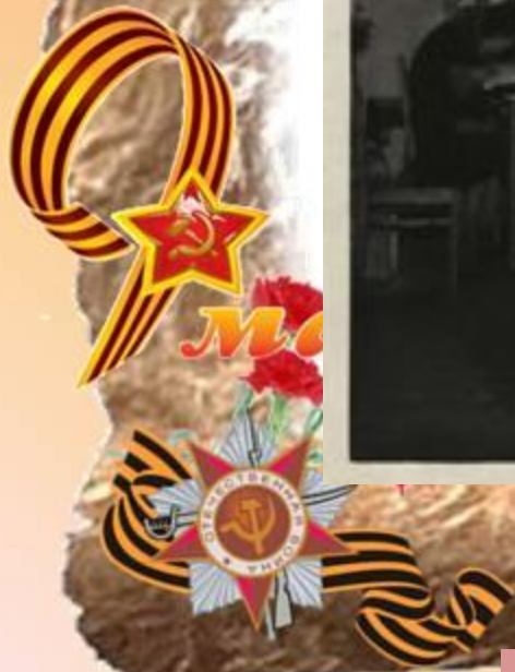
трудовые будни библиотекаря