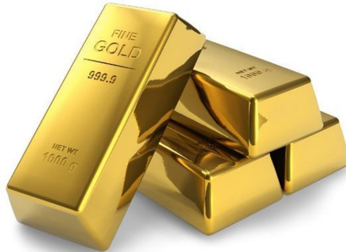
Металлы: Золото, серебро, медь...