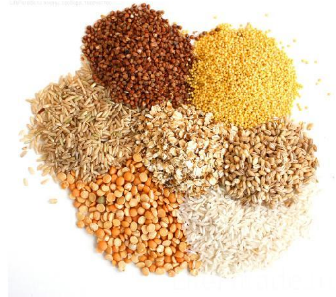
Зерновые: Пшеница, овес, ячмень...