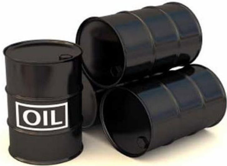
Энергетическое сырье: Нефть, газ, дизель...