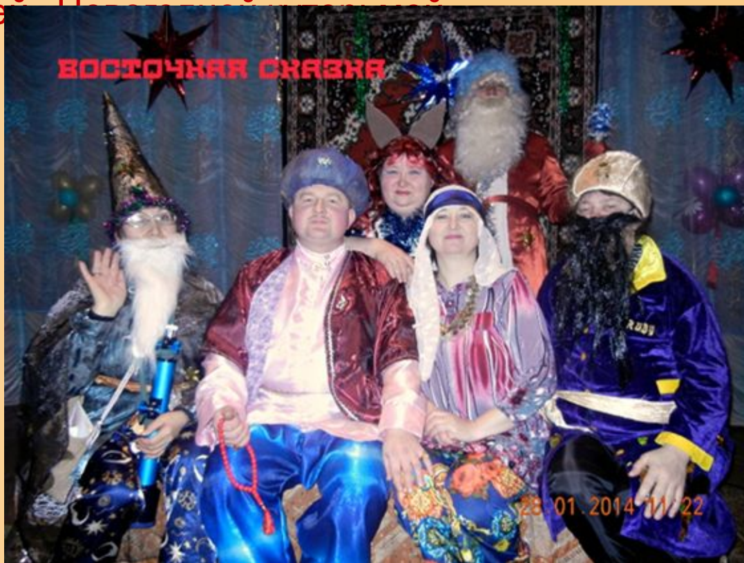
«Ошибка царя Еремея»

Самой большой, кропотливой театральной работой для коллектива являются постановки сказок и постановки по литературным произведениям. В 2014 году коллектив «Маски» удивил зрителей рождественской работой -«Восточная сказка», 2015 год- интересное коллективное детское творчество «Сказка о золотом петушке», в 2016 году- сказочная история «Золушка», весенняя история «Зачем Колыван весну украл», в 2017 году яркая постановка «Молодильные яблочки», 2018 год –трудоёмкая работа над постановкой «Ошибка царя Еремея», в 2019 году повеселили гостей Новогодней ёлки