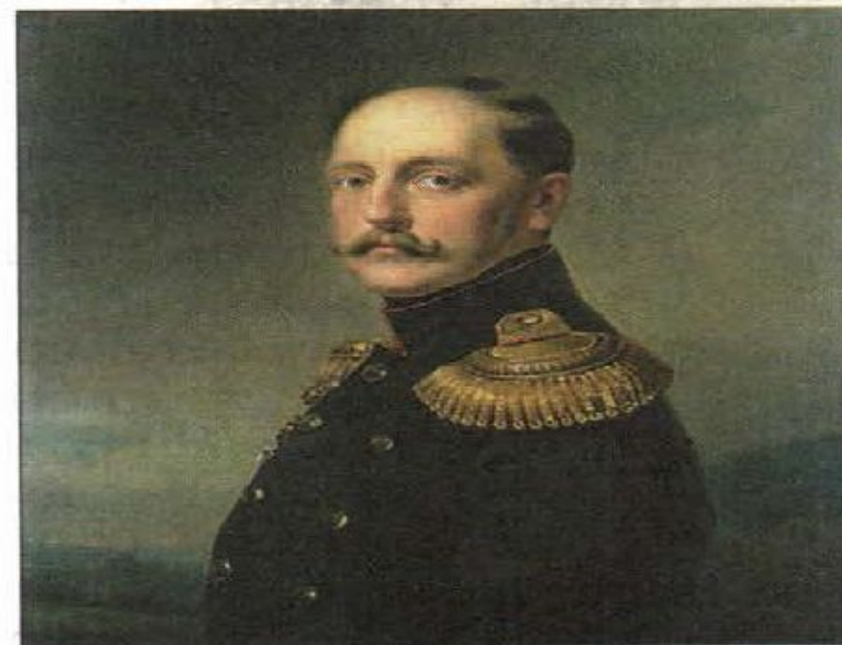
Николай I. Художник Э. Верне

Заговор декабристов Николай I связывал с влиянием западноевропейских теорий. Однако из материалов следствия ему открылась картина страшных злоупотреблений во всех сферах жизни. Император понял необходимость проведения если не реформ, то хотя бы серии мер с целью устранить существующие пороки в обществе и предотвратить новые революционные выступления.