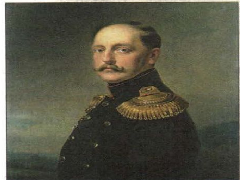
Николай I. Художник Э. Верне

Заговор декабристов Николай I связывал с влиянием западноевропейских теорий. Однако из материалов следствия ему открылась картина страшных злоупотреблений во всех сферах жизни. Император понял необходимость проведения если не реформ, то хотя бы серии мер с целью устранить существующие пороки в обществе и предотвратить новые революционные выступления.