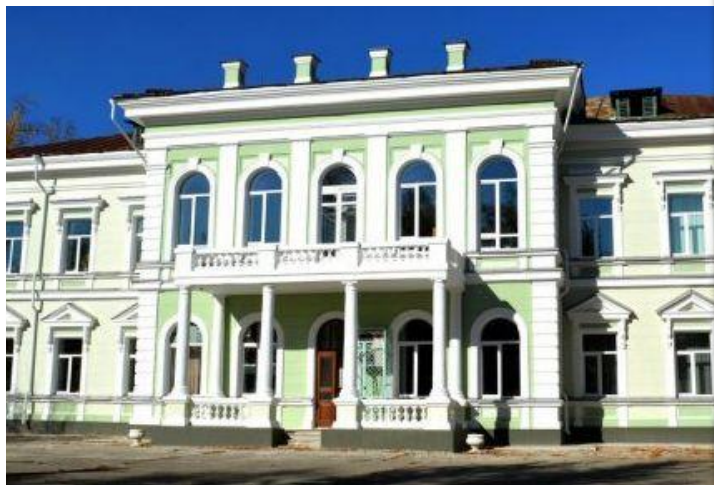
Городской дом культуры