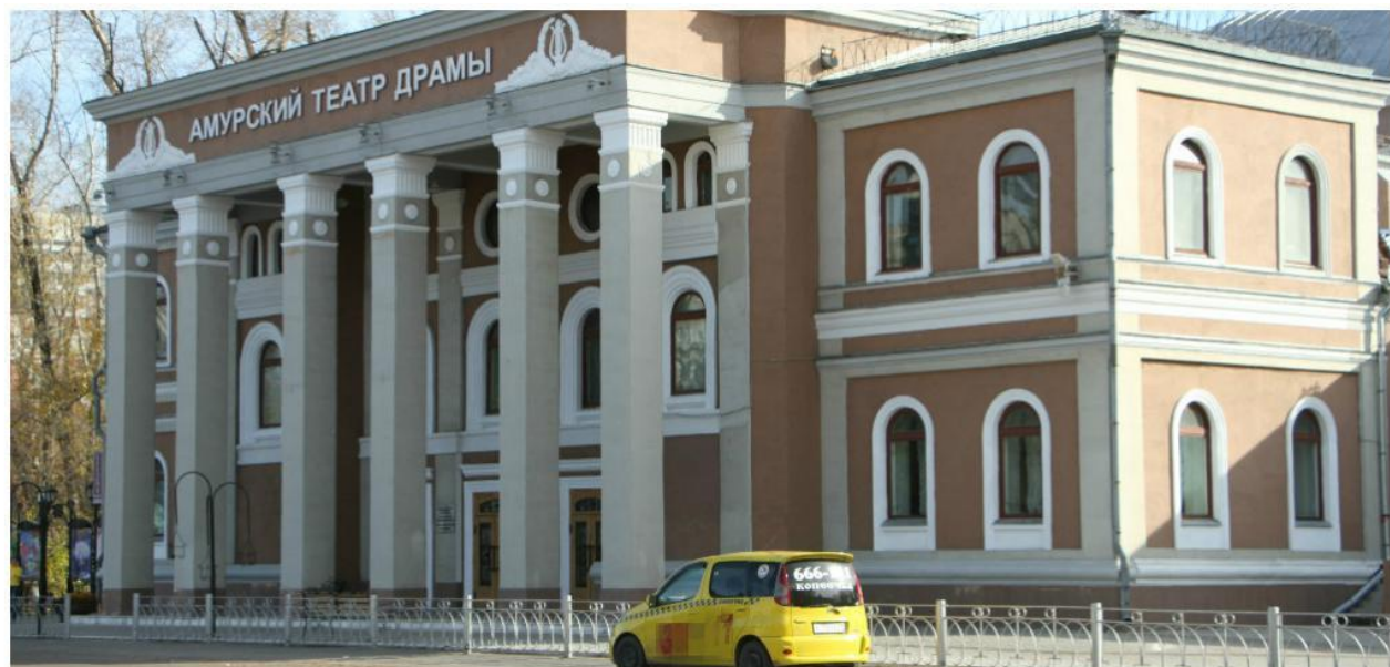
Амурский областной театр драмы