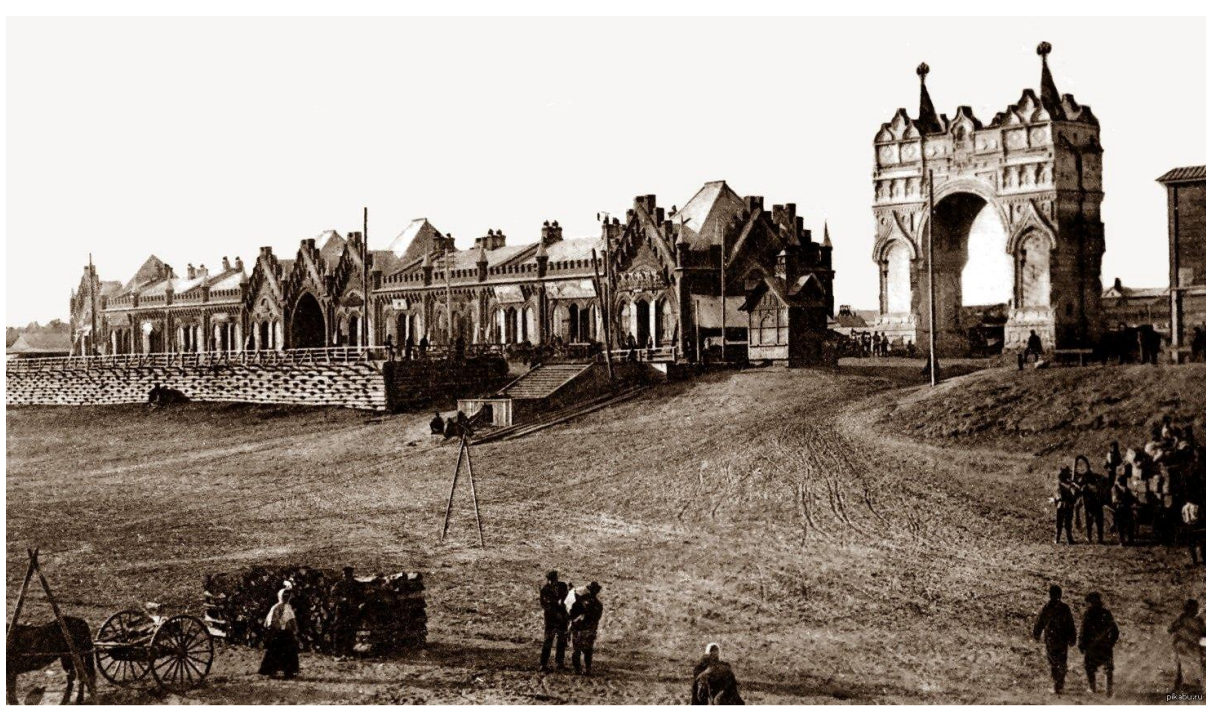
Торговые ряды «Мавритании» и Триумфальная арка