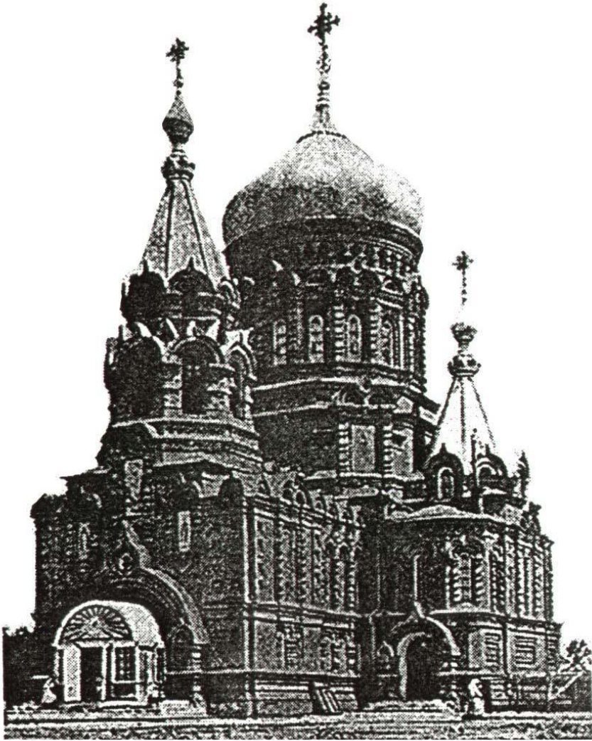
Свято-Троицкая церковь (Шадринский собор)