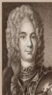
Павел Иванович Ягужинский (1683-1736)