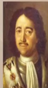
Император Петр I Великий (1672-1725)