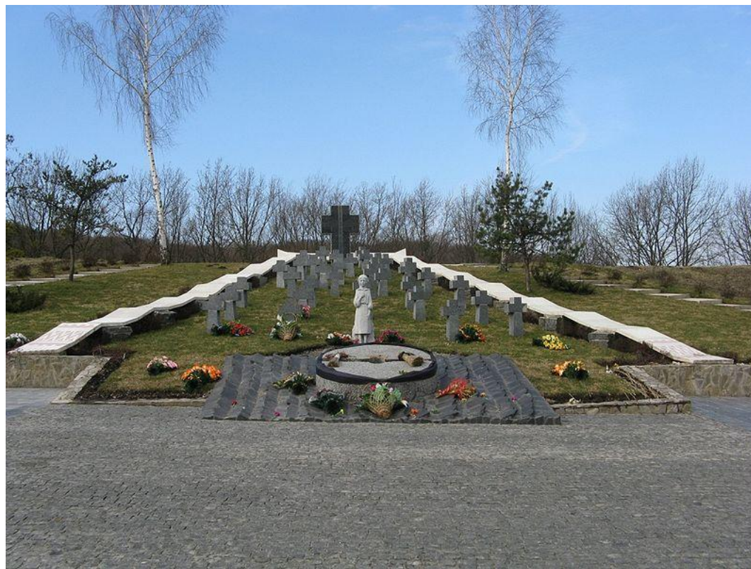
г. Обухов, Киевская обл.