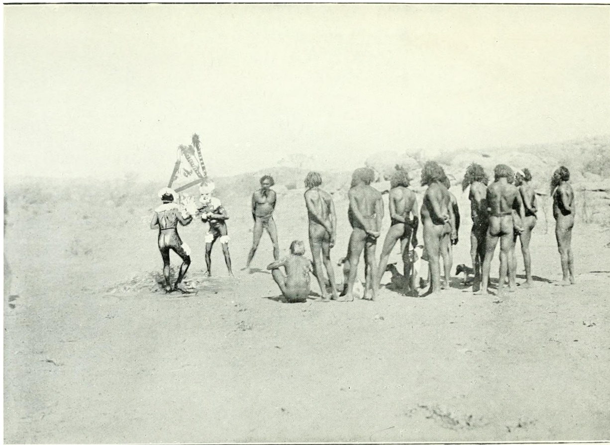
Церемониальный австралийский танец «Интичиума»