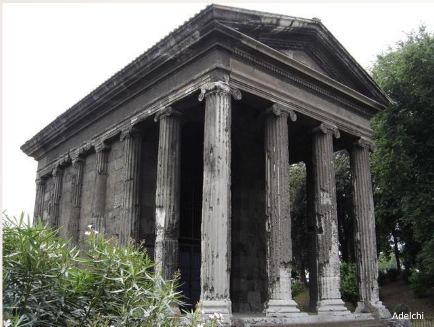
Храм Портуна на Бычьем форуме.

В Риме один из самых известных рынков рабов находился на Бычьем форуме