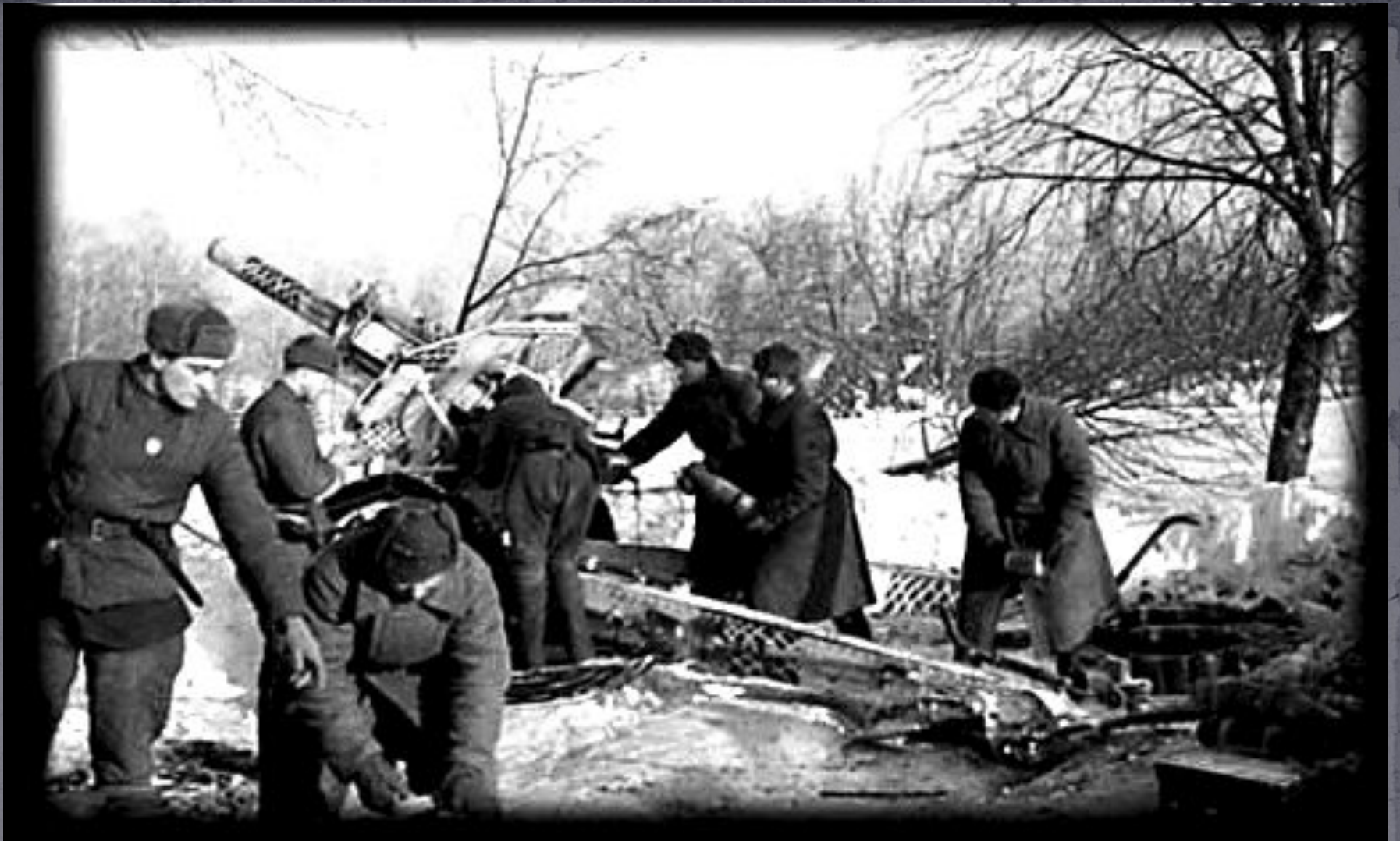
Морские артиллеристы на боевой позиции Фото военных лет