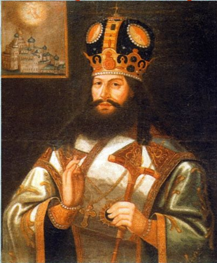
Патриарх Никон (1605-1681)