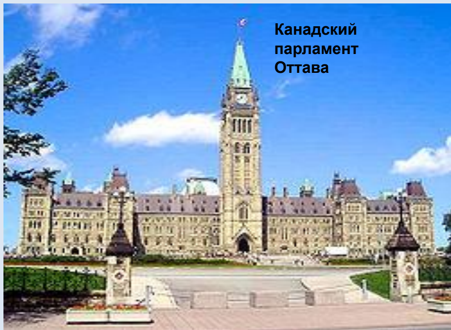
Канадский парламент Оттава