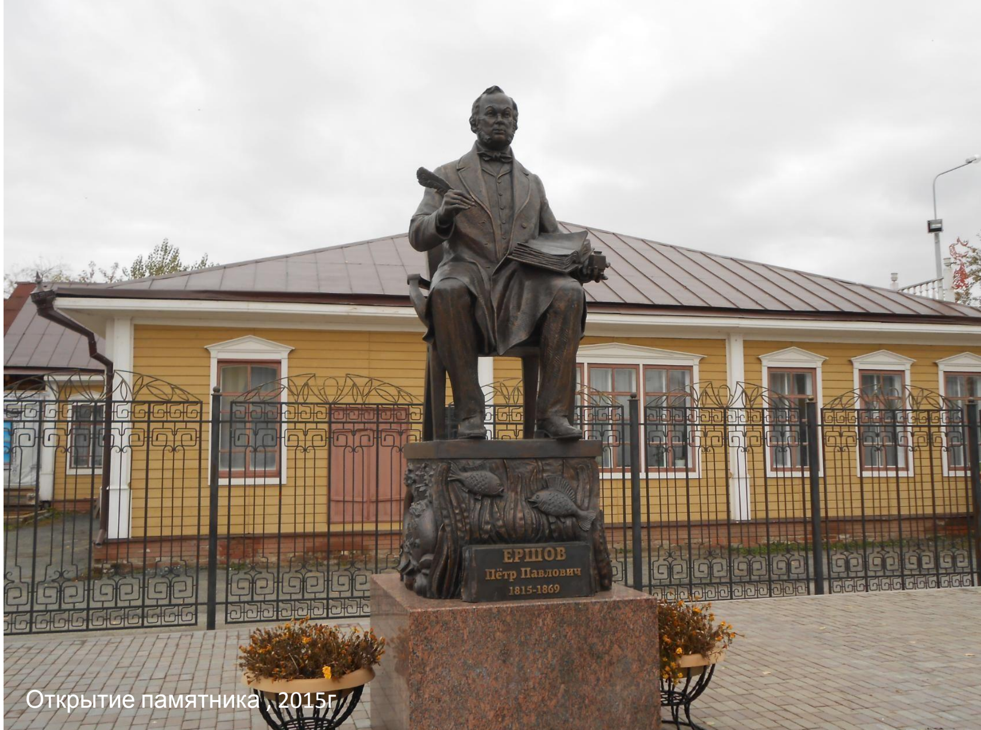
Открытие памятника, 2015г