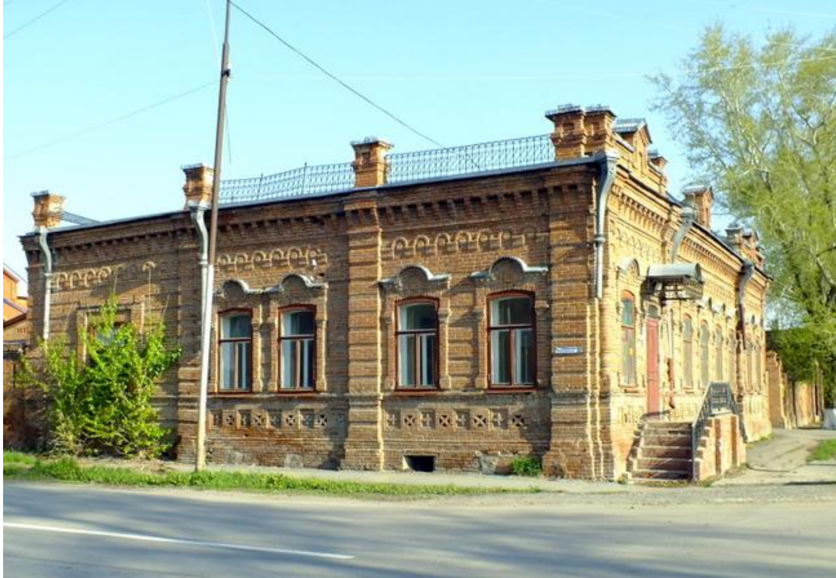
Дом купца Г.Ф.Клыкова, ул.Ленина, 21 Усадьба Г.Ф. Клыкова - одно из лучших и редких в городе купеческих владений конца 19 века.