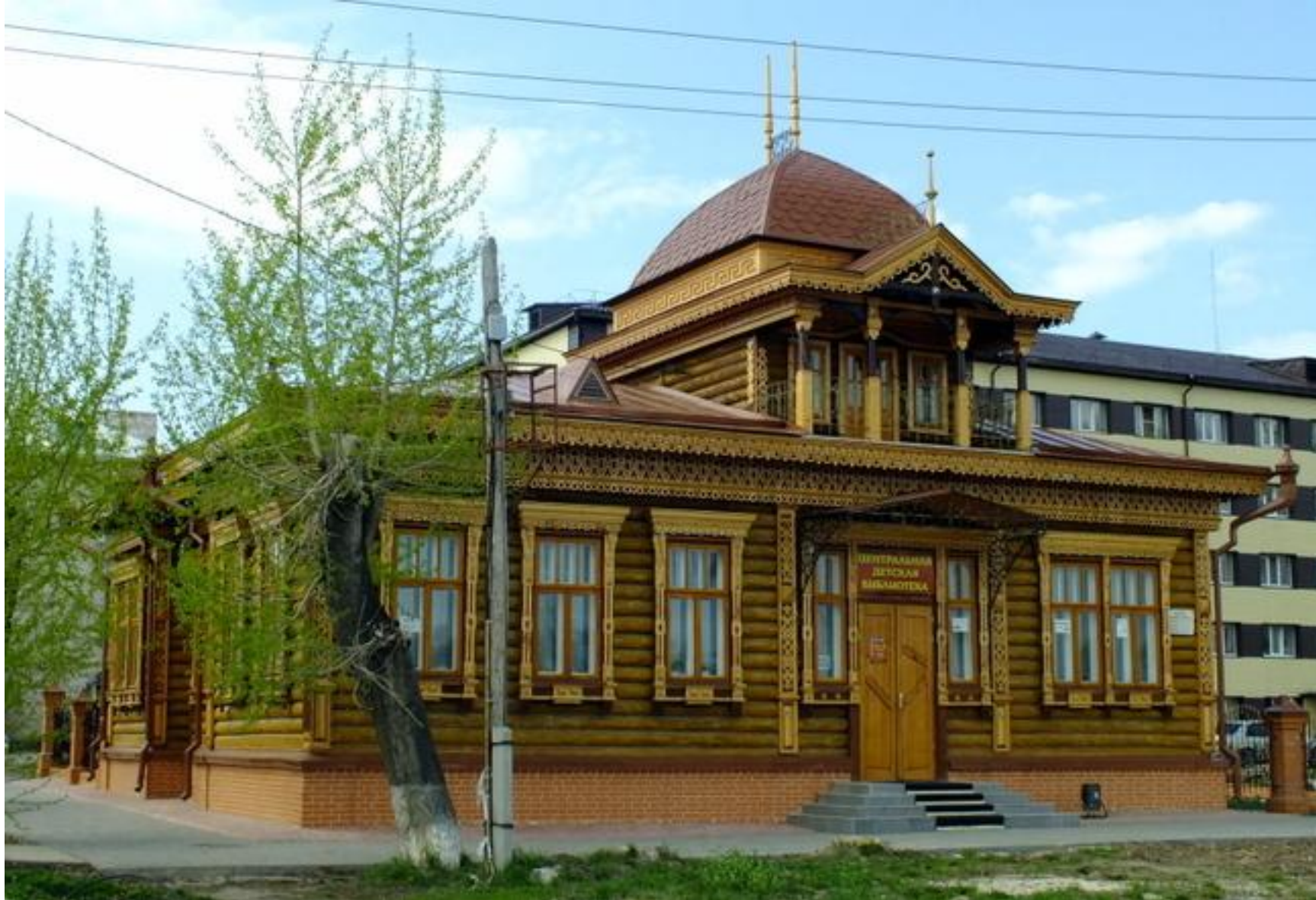
Центральная детская библиотека (ул. Просвещения, 25) - очень красивое деревянное здание 1914 года постройки - дом купца Н.К. Постникова