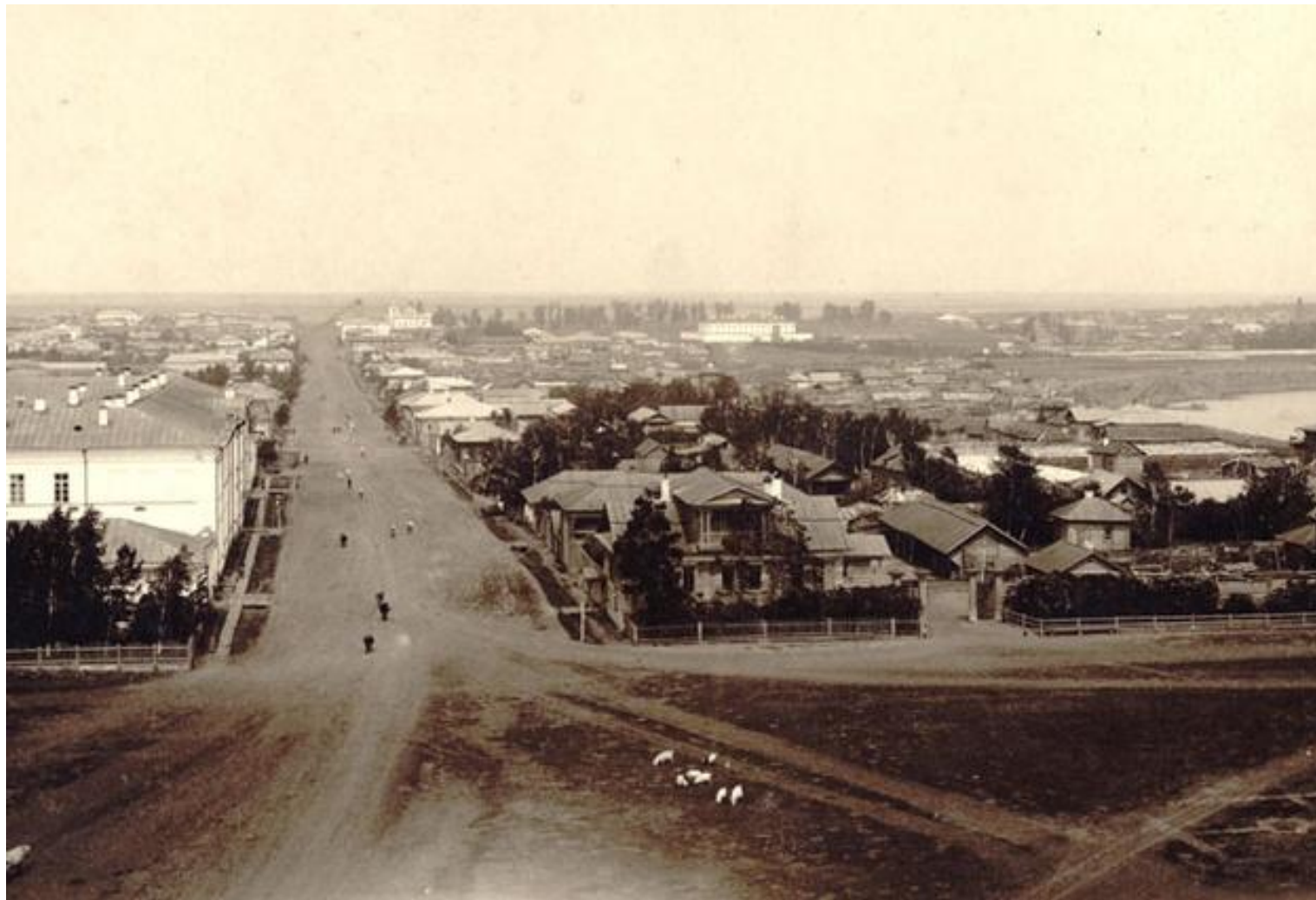
Вид на Коркинскую улицу (сейчас ул. Ленина) с колокольни Богоявленского собора (XIX в.)