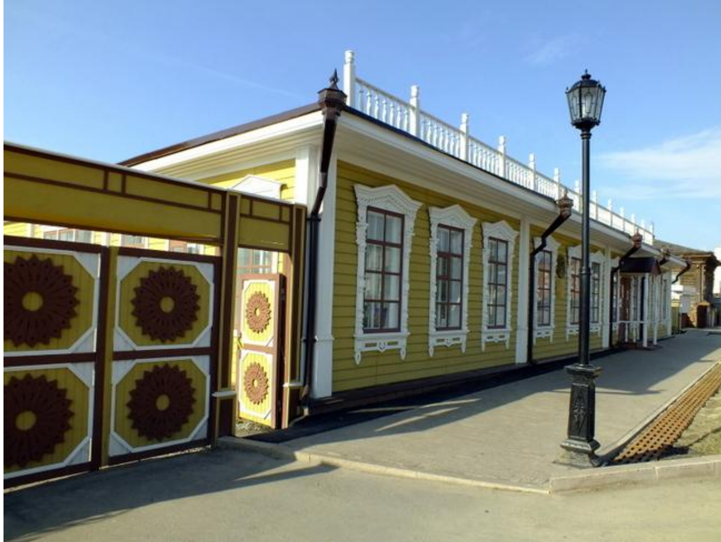
Культурный центр имени П.П. Ершова (ул. Советская, 30)