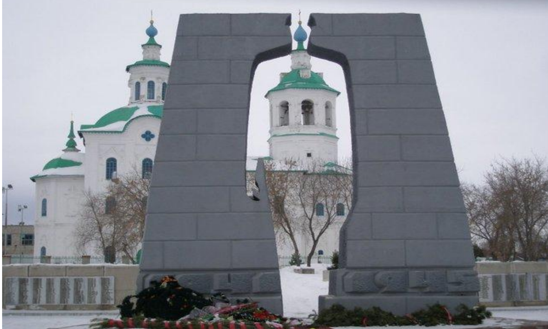
Мемориал "Памяти павших" на Соборной площади.