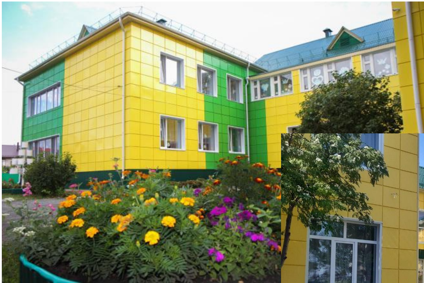
Д/С № 24 г. ИШИМ