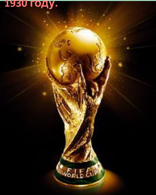
Кубок мира по футболу(ФИФА) 1921г.

После избрания Жюля Римэ президентом ФИФА в 1921 году было ратифицировано предложение считать последующие Олимпийские футбольные турниры «чемпионатами мира по футболу среди любителей». Эти турниры — 1924 и 1928 годов — выиграла сборная Уругвая. Благодаря этим успехам у Ассоциации футбола Уругвая не было конкурентов в борьбе за организацию первого в истории Кубка мира ФИФА (более известного в русском языке просто как чемпионат мира по футболу), который прошёл в 1930 году.