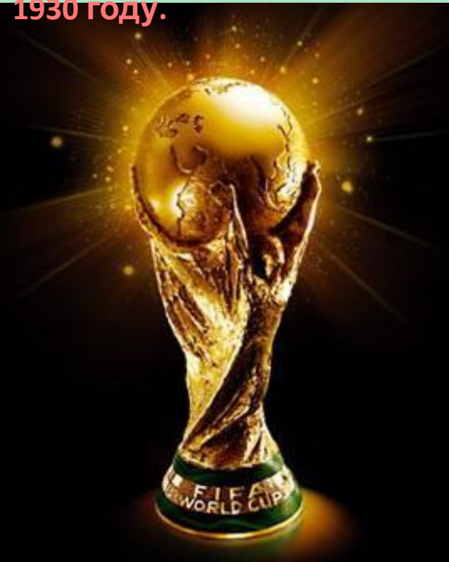
Кубок мира по футболу(ФИФА) 1921г.

После избрания Жюля Римэ президентом ФИФА в 1921 году было ратифицировано предложение считать последующие Олимпийские футбольные турниры «чемпионатами мира по футболу среди любителей». Эти турниры — 1924 и 1928 годов — выиграла сборная Уругвая. Благодаря этим успехам у Ассоциации футбола Уругвая не было конкурентов в борьбе за организацию первого в истории Кубка мира ФИФА (более известного в русском языке просто как чемпионат мира по футболу), который прошёл в 1930 году.