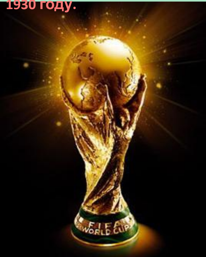
Кубок мира по футболу(ФИФА) 1921г.

После избрания Жюля Римэ президентом ФИФА в 1921 году было ратифицировано предложение считать последующие Олимпийские футбольные турниры «чемпионатами мира по футболу среди любителей». Эти турниры — 1924 и 1928 годов — выиграла сборная Уругвая. Благодаря этим успехам у Ассоциации футбола Уругвая не было конкурентов в борьбе за организацию первого в истории Кубка мира ФИФА (более известного в русском языке просто как чемпионат мира по футболу), который прошёл в 1930 году.