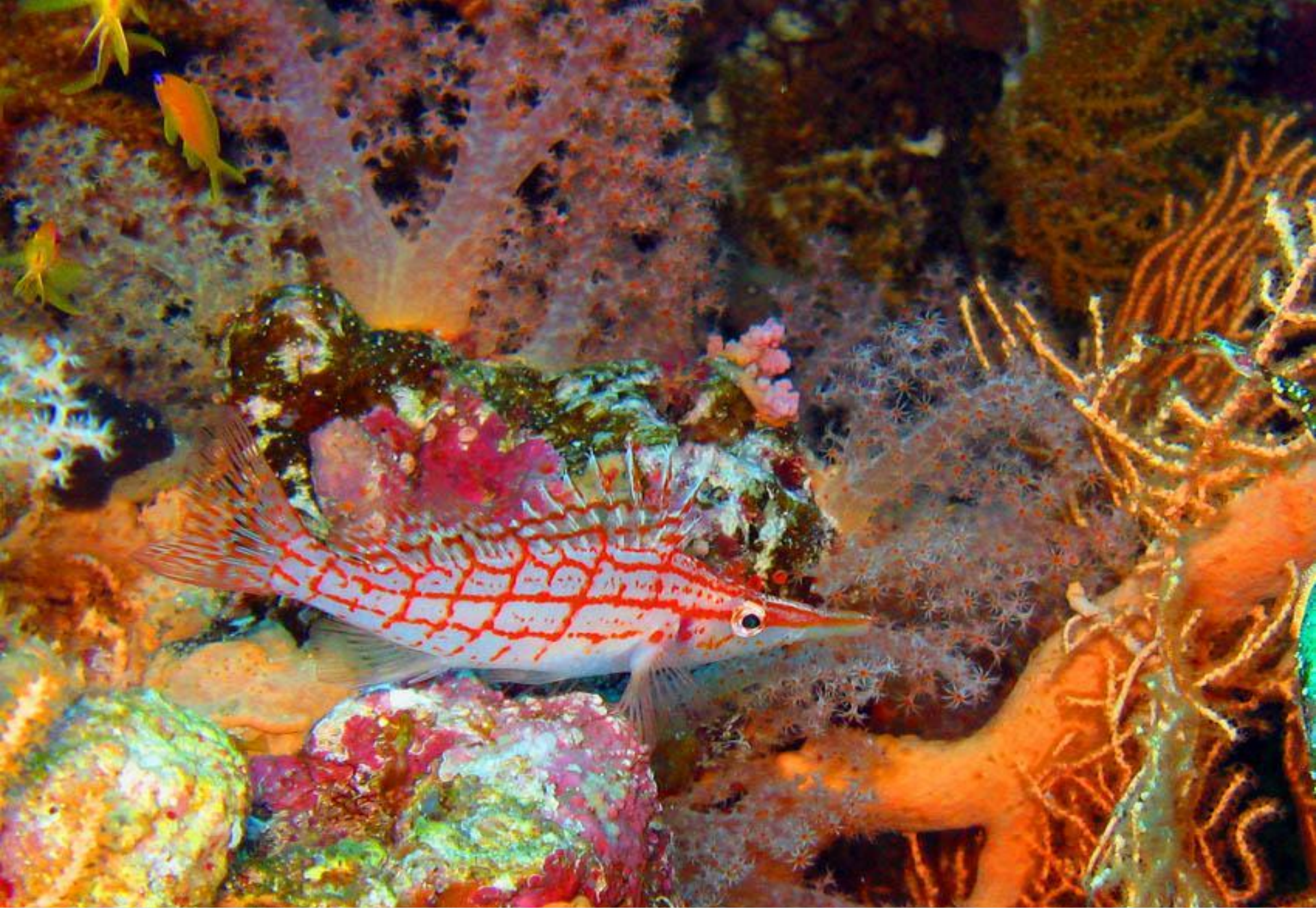
Подводных рифов, чудных рыбок