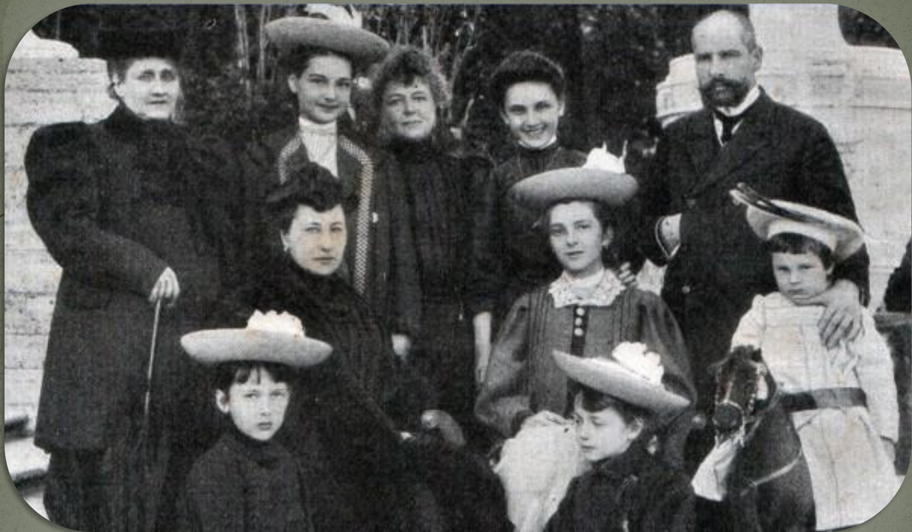
На фото П.А. Столыпин с семьей, 1907г