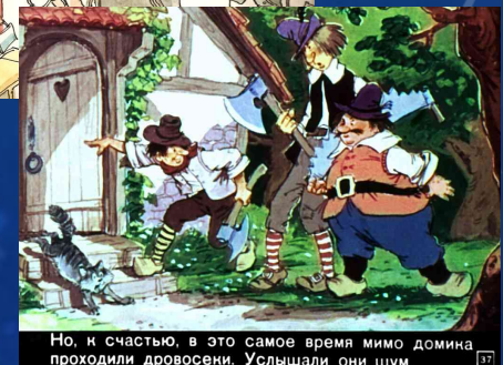
Но, к счастью, в это самое время мимо дома проходили дровосеки. Услышали они шум.

Профессия людей, спасших Красную Шапочку и ее бабушку?