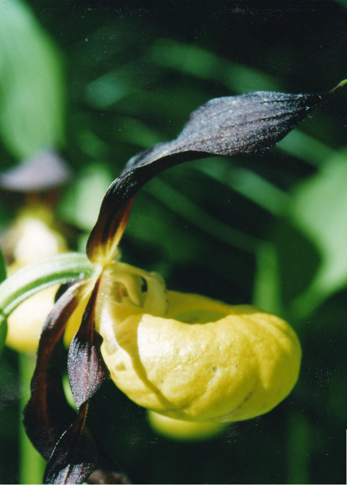
Cypripedium calceolus L. (Евразия)

Особи одного вида занимают определённую географическую территорию (ареал).