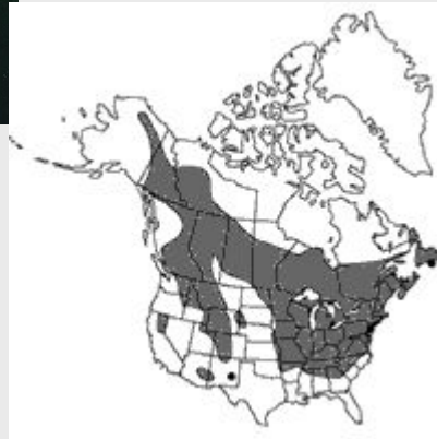
Cypripedium parviflorum (Северная Америка)