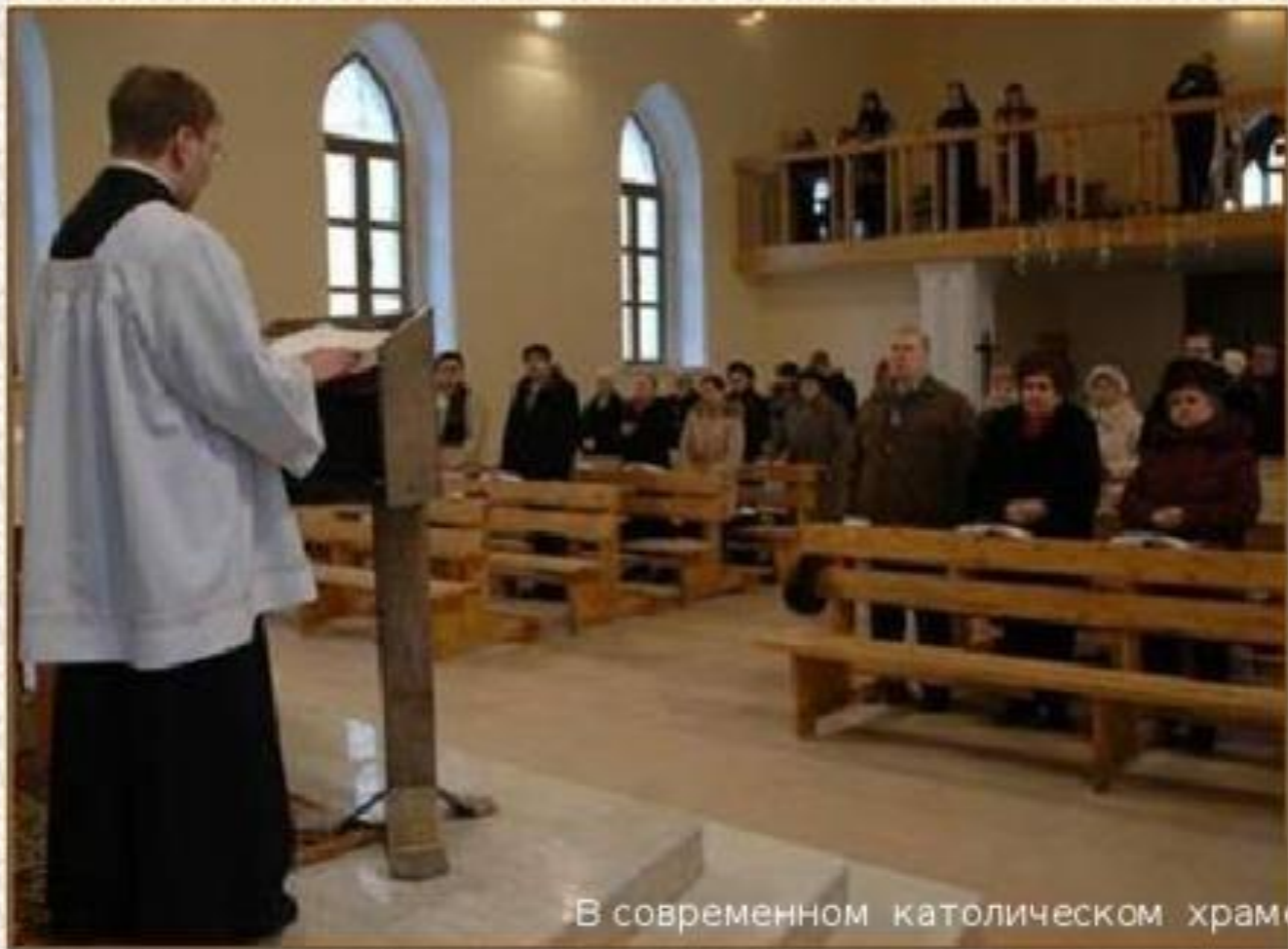
В современном католическом храме

У магометан и католиков послы Владимира не почувствовали никакой духовной красоты.