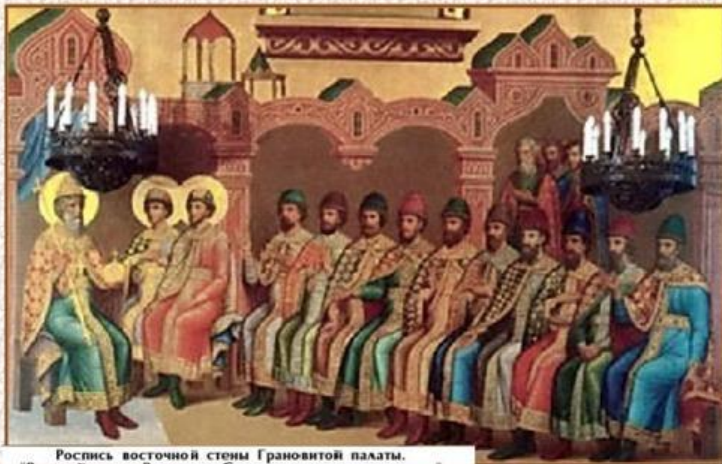
Роспись восточной стены Грановитой палаты. "Великий князь Владимир Святославович с сыновьями"

Возвратившись в Киев, великий князь Владимир прежде всего крестил двенадцать своих сыновей.