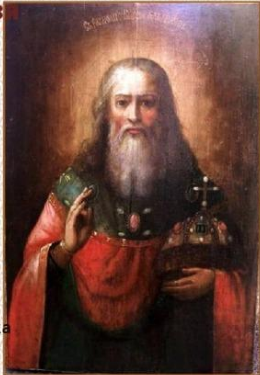
Икона начала XIX века

Князь Владимир сильно изменился после крещения. Он продолжал оставаться победоносным полководцем и мудрым строителем государства, но в отношении к людям стал примером доброты, милосердия и сострадания.