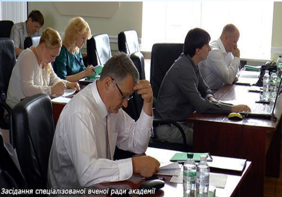
Засідання спеціалізованої вченої ради академії

І надалі цей показник продовжує зростати. Серед регіонів України Одеський займає 4 місце (142 та 599 осіб).