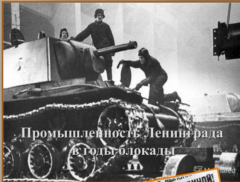
Промышленность Ленинграда в годы блокады

Голодные измученные люди находили в себе силы работать.