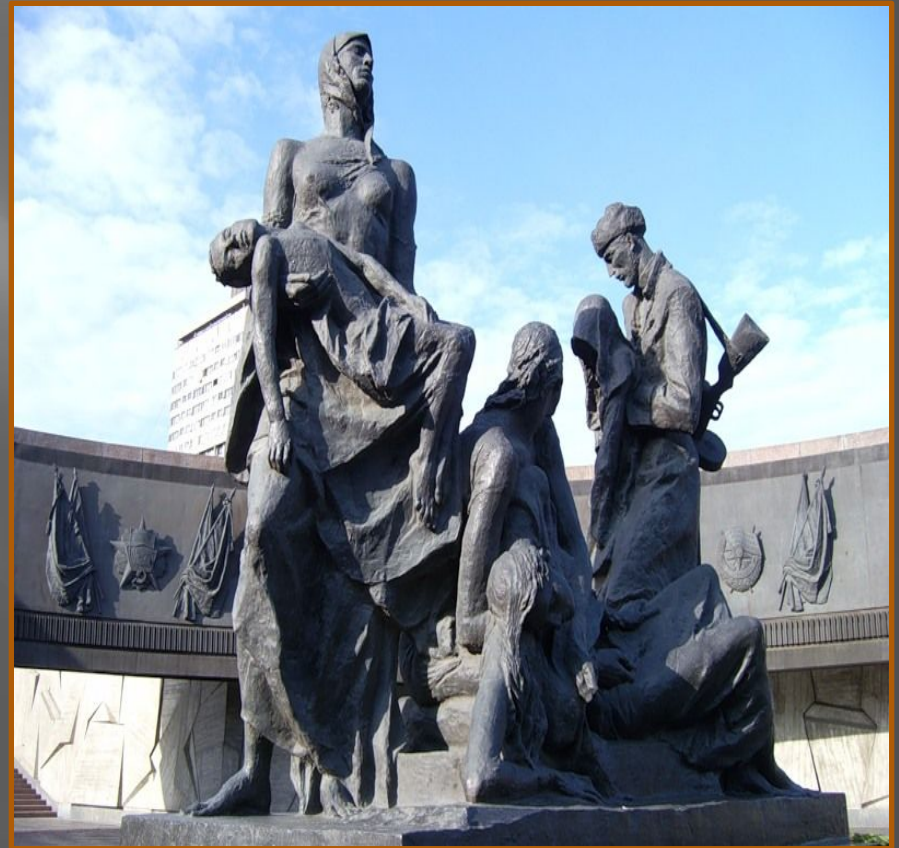
Памятники героическим защитникам блокадного Ленинграда.