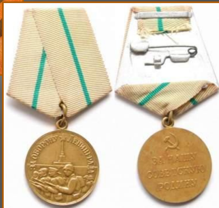
Медаль за оборону Ленинграда

Указом Президиума Верховного Совета СССР Город-герой Ленинград был награждён орденом Ленина и медалью «Золотая Звезда».