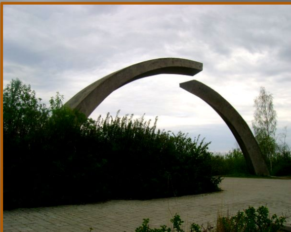
Памятник в честь разрыва блокады Ленинграда.

Блокада Ленинграда стала самой кровопролитной осадой в истории человечества