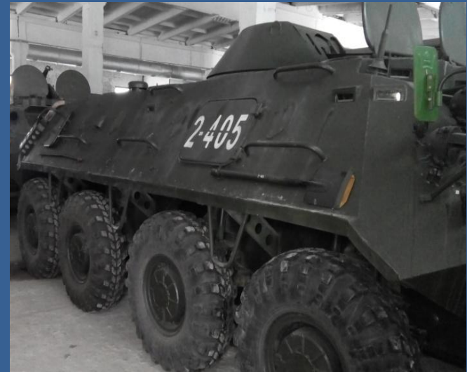
бронетехніка – 5%.