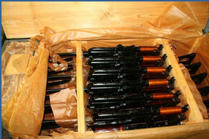
озброєння – 90 %