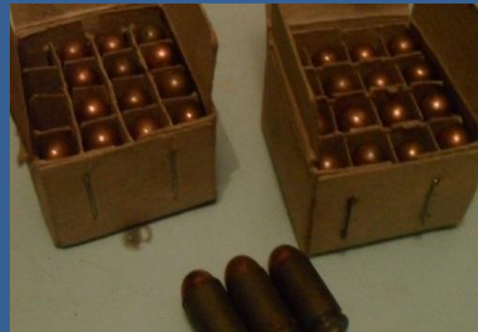
боєприпаси – 80 %