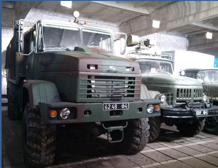
автомобільна техніка – 85 %